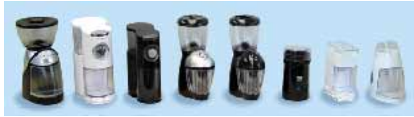
全新系列之咖啡豆研磨器

現時集團95%之營業額來自電熱水壺及電熨斗。在過去12個月，集團於咖啡相關產品之開發已取得可觀的進展，預期未來數年咖啡相關產品對集團的銷售額將會有較顯著的貢獻，集團之策略為每2至3年開發一種新產品系列。