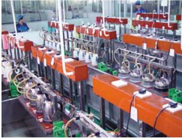
全自動產品壽命測試實驗室

分散市場地區亦為本集團之另一目標，於二零零二年財政年度前，集團投放大量資源於歐洲市場之產品開發及營銷管理，於二零零一年財政年度，歐洲市場之銷售佔集團銷售額70%，北美市場則只佔9%。集團理解長遠來說，集團不能長期忽視北美洲的龐大市場，並開始投放較多資源於北美洲之市場拓展，努力亦已漸見成果。在剛過去的財政年度，北美市場約佔集團營業額的22%，集團希望在未來能達致北美洲市場佔集團營業額的三份之一左右。