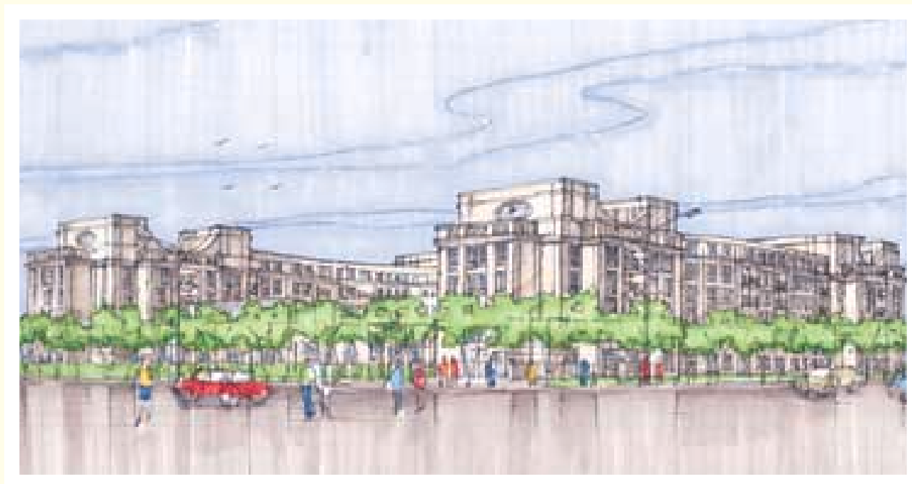
畫家為本集團位於加拿大多倫多Markham的發展項目繪畫的草圖。