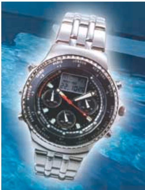
多功能行針跳字手錶，能顯示世界各大城市之時間，且具有計時及倒數等功能。

本集團最近獲得加拿大多倫多市議會批准，將St. Thomas Street發展項目之土地用途由酒店改為住宅用途。該幢豪華住宅大廈之設計經已落實，而本集團亦正在建設該物業之示範展銷單位，計劃於二零零三年底前分期預售該項目。