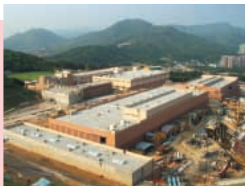
大埔自來水處理廠及泵站

本集團於去年透過其佔百分之五十五權益之一間聯營公司—其士雅康有限公司所開展之飲食環保業務未如理想，主要為經濟環境疲弱所致。本集團將繼續加強開發納米催化式氧化科技(NCCO)以解決本港飲食業所遇到的油煙污染問題。