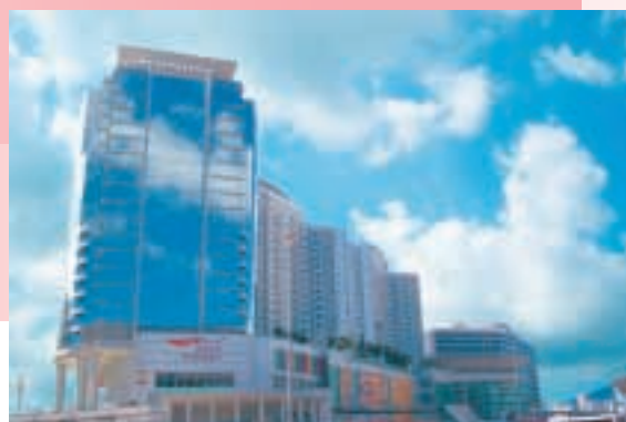
為紅磡國際都會安裝電力設備