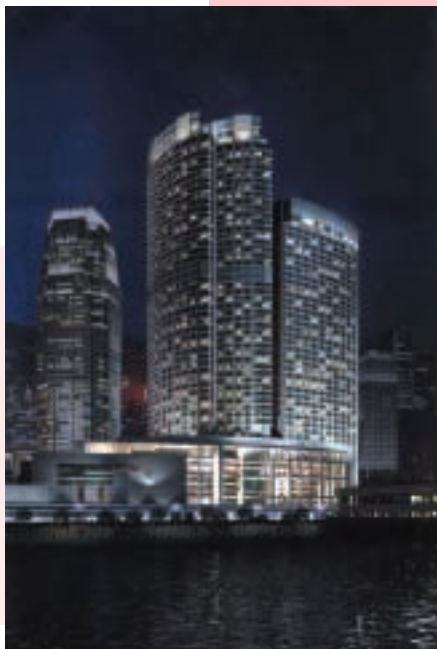
為香港中環機場鐵路總站香港四季酒店安裝升降機及進行鋁工程