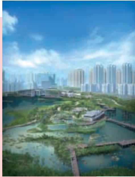
位於新界天水圍 國際濕地公園

年內，其士建築集團手頭土木工程合約為將軍澳海港發展一三七區第二期之興建海堤及填海工程，以及佐敦道第三期填海及餘下工程。