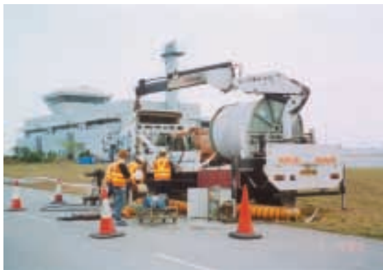
在香港國際機場進行的RIB LOC管道翻新工程

為配合本集團於「免挖掘」管道翻新技術建立雄厚根基之策略，本集團繼續增加在瑞典Norditube Technologies AB（「Norditube」）及澳洲上市公司Rib Loc Group Limited（「RibLoc」）之股本權益。此兩間公司專門開發該等技術及製造相關物料。於本報告日期，本集團分別持有Norditube及RibLoc百分之五十四點二一及百分之二十一