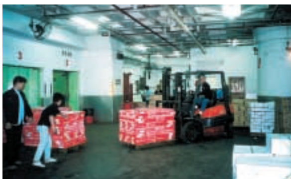
位於葵涌冷藏倉庫卸貨區

儘管市道不景及競爭熾熱，物流及倉儲業務在去年仍為本集團提供穩定的盈利貢獻。位於葵涌之倉庫為客戶提供多種具效率及可靠之冷藏倉庫服務。憑藉優質的倉儲服務，其士冷藏倉庫有限公司於二零零三年一月獲香港品質保證局頒發ISO9002品質證書。