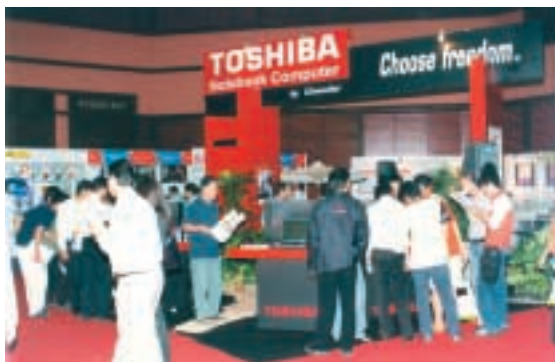
於泰國二零零三年展覽會中展出東芝筆記簿型電腦

其士科技集團在截至二零零三年三月三十一日止年度之表現令人失望，主要由於結束零售業務所致。其士科技集團錄得之營業額約為港幣六億八千八百萬元，較去年下跌百分之十一，年內之虧損為港幣二千三百萬元，每股虧損為港幣十三點三仙。