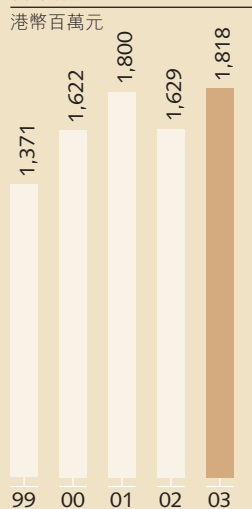
股東應佔溢利淨額