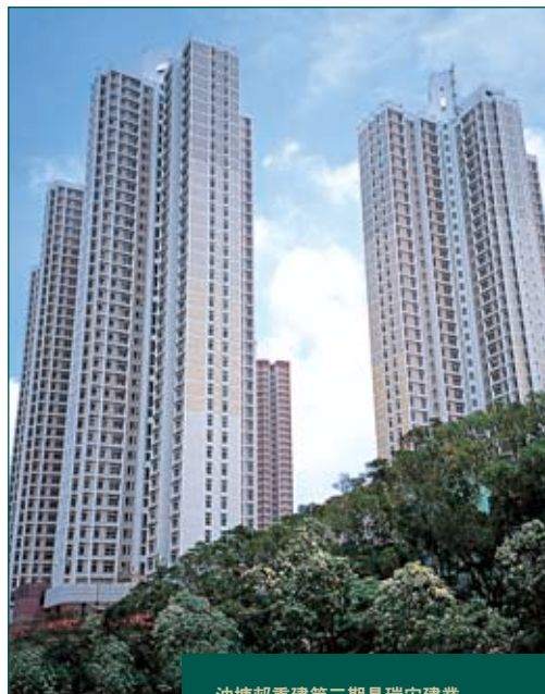
油塘邨重建第三期是瑞安建業 本年度為房委會完成的四項建築工程之一

未來一年，預期房委會將會推出逾十份新工程合約，集團投得合約的機會應可稍為提高。房委會亦有可能推出一至兩項試驗性工程供六家包括瑞安承建在內之「優質承建商」競投。