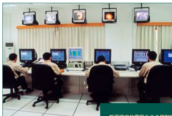
新蒲瑞安的電腦化中央控制室

碎石是珠海桂山島地盤平整工程的副產品，但由於生產量太低，不足以帶來合理的盈利貢獻。由於建安減低石料使用量，以及南丫發電廠工程的海石合約屆滿，直灣的石料產量跌至六十六萬噸，只及上年度之四成，但供應予香港迪士尼樂園及九號貨櫃碼頭工程的大型石料產品則繼續。由於廣州的石料價格下跌，新會石礦場已停止供應石料予廣州建安，並集中供應予本地市場。