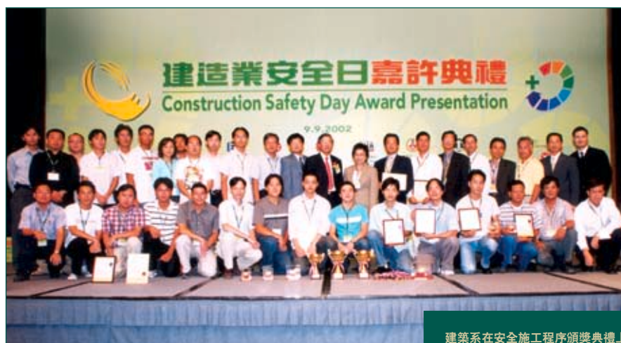
建築系在安全施工程序頒獎典禮上 共獲得十四項金、銀、銅獎