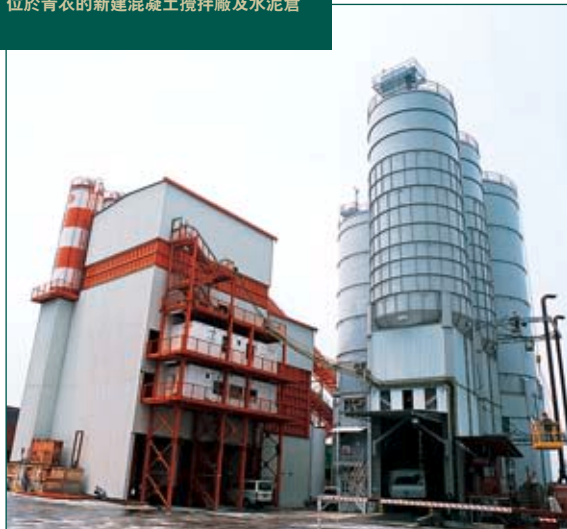
位於青衣的新建混凝土攪拌廠及水泥倉

過去一年，內地房地產市場發展蓬勃，帶動對物料採購服務的需求，亞洲建材這方面的業務亦因而大幅增長，公司最近更成為澳門一賭場發展項目之指定物料採購代理。亞洲建材亦供應物料予生產商，務求能為主要客戶建立有效的供應鏈。