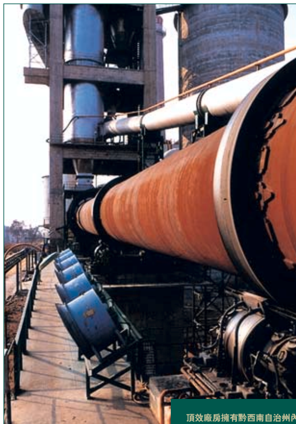
頂效廠房擁有黔西南自治州內唯一的旋窯生產線

集團利用廣州的實驗室為各廠房研究改善水泥品種配比以及減低成本的方法，並安排部分貴州員工到香港接受培訓，以提高員工士氣及技能，長遠而言可提升當地人員的素質及管理水平。