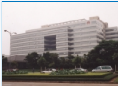
深圳華為中心 Shenzhen Huawei Centre