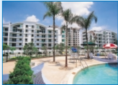
常州新城市花園 Changzhou New City Garden