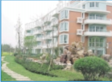
南通天安花園 Nantong Tian An Garden