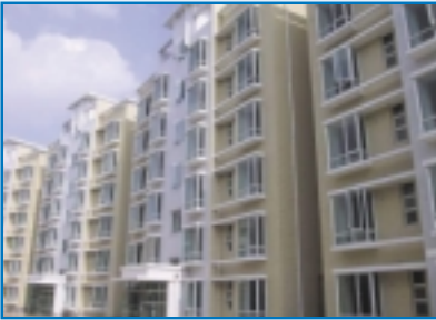
上海嘉富麗苑 Shanghai California Court