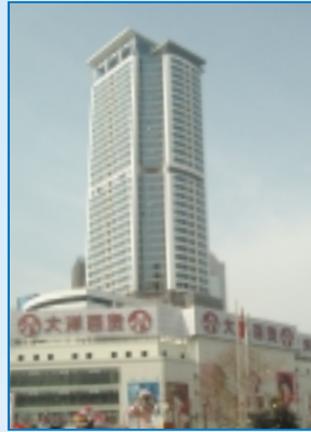
南京天安國際大廈 Nanjing Tian An International Building