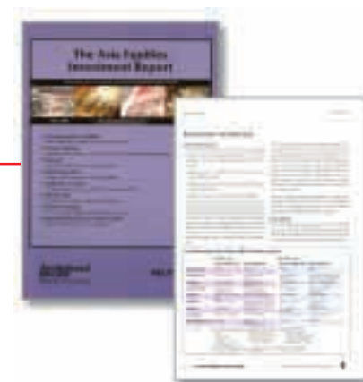
在採購及銷售層面均屬亞洲消費行業中最佳投資者關係的公司 路透社及機構投資者研究集團的亞洲股市投資報告， 二零零三年六月