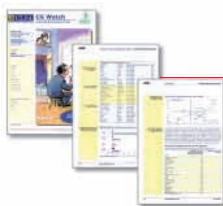
香港最佳公司管治 (頭4名) 亞洲最佳公司管治 (頭20名) CLSA · 二零零三年四月