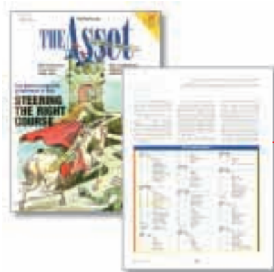
香港最佳公司管治 (第6名) The Asset · 二零零二年十二月