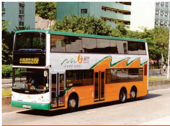
新巴擁有 769 輛巴士，行走 100 條路線，為港九新界的公眾運輸網絡服務。

集團於二零零三年一月二十九日成功完成新創建集團有限公司（「新創建」）（前稱太平洋港口有限公司）、新世界創建有限公司及新世界基建有限公司（「新基建」）之重組。集團重組使三間附屬公司的內在潛力得以充份發揮，以開展更廣闊的業務層面、精簡公司架構，以及重整集團的資產負債。新組成的新創建將統掌集團的服務、基建和港口業務，成為這三大業務的投資旗艦公司。