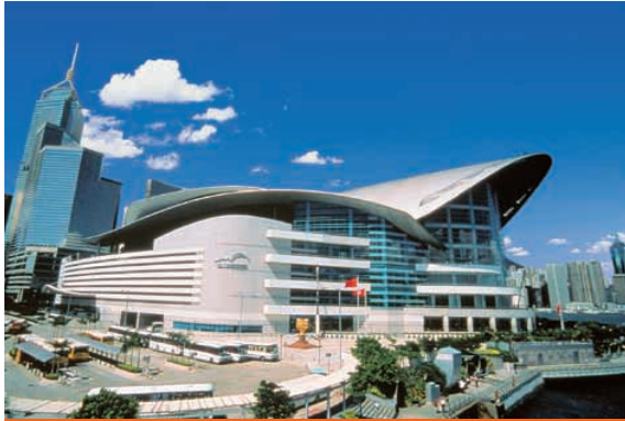
會展中心為全球最獨特和最具規模的世界級會議及展覽場館之一。

六月以後，會造成預算收入減少或延後兌現。所幸會展中心採取果斷的節流措施和振興業務方案，才令業績未如預期般受影響。