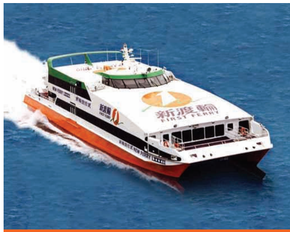
新渡輪及新渡輪(澳門)共經營十一條港內外及來往港澳航線。

環境工程業務表現穩定。香島園藝有限公司(「香島園藝」)年內表現理想。香島園藝從事園林藝及綠化工程承包服務，專門為企業及私人客戶供應護養植物，業務規模雖小，但盈利貢獻卻相當穩定，而且該公司正在積極進行市務推廣，冀能拓展業務規模。