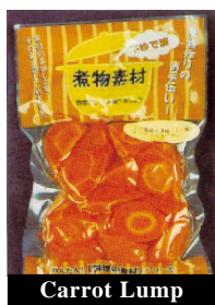
Carrot Lump 亂切胡蘿蔔 (小)