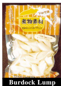
Burdock Lump 亂切牛蒡