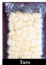
Taro 芋頭 (大)