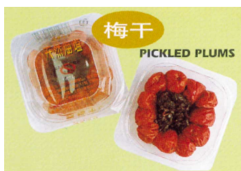
Pickled Plums 梅乾

中國政府已頒佈多項法例、規則及規例，以規管食品的生產與銷售及食品衛生。此等法例、規則及規例載有適用於蔬果產品的規定，本集團的產品須遵守該等規定。據董事所知，本集團於所有時間均一直遵守中國所有適用的食品及食品衛生法例、規則及規例。