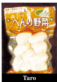
Taro 里芋 (小)