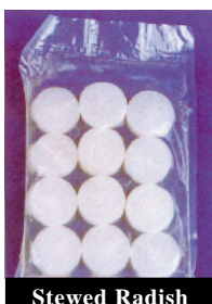
Stewed Radish 水煮大根