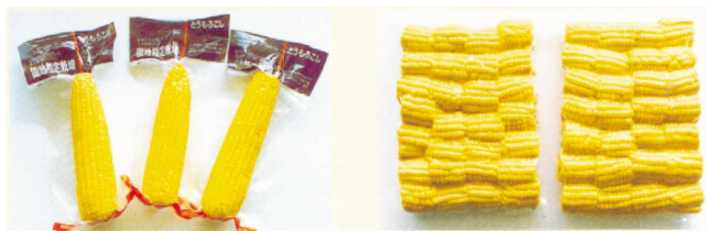
Sweet Corn 玉米

視乎本集團客戶的特定需要及包裝要求而定，若干加工蔬菜會按客戶的要求及所規定的規格用水煮沸，以真空包裝及以高溫及高壓消毒。該等加工可讓本集團客戶即時品嚐其產品，並延長產品的保存期。一般而言，消毒溫度標準為攝氏100度至121度，而壓力標準則介乎0.14 Mpa至0.18 Mpa不等。