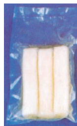
Pickled Radish 鹽漬大根