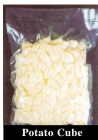
Potato Cube 丁狀馬鈴薯