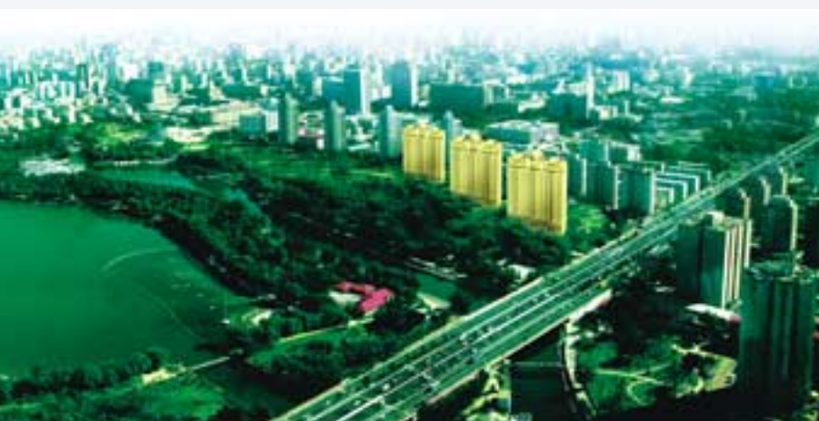
玉淵潭公寓鳥瞰圖(效果圖)

# 註：中環酒店建築面積39,079平方米，中環酒店寫字樓及配套設施建築面積10,424平方米，總建築面積49,503平方米