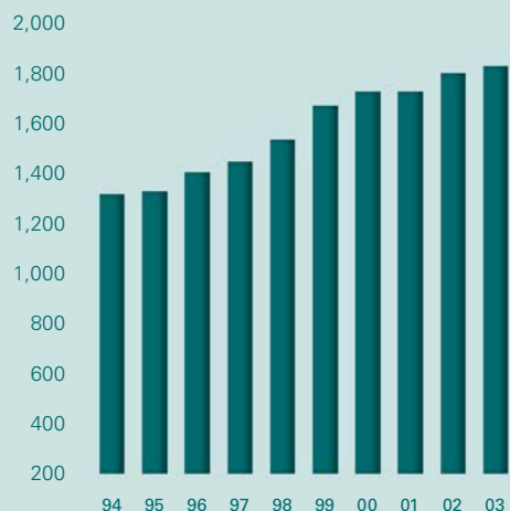
每港幣千元員工開支之可用噸千米