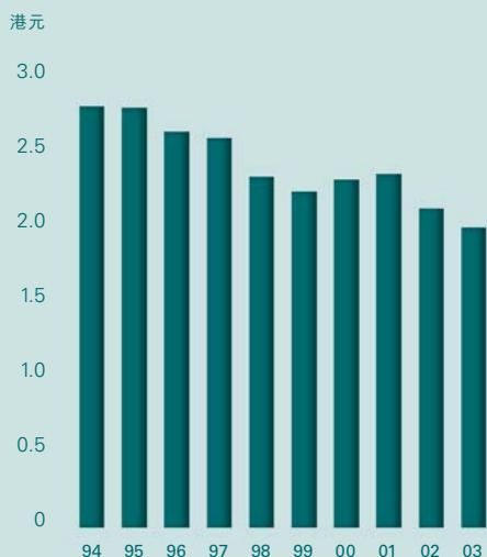
每可用噸千米成本