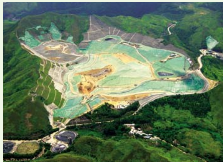
新界東北垃圾堆填區之深度位於全球之前列，其對周邊環境之影響受到嚴格監控。

石油氣加氣業務之成功，促使易高環保能源有限公司密切留意其他可以促進環境保護之商機。其第一個計劃，是已於年內與新界東北堆填區之經營者簽訂協議，運用堆填區沼氣產生之甲烷氣，作為煤氣生產之部分燃料。易高將會負責興建位於打鼓嶺之沼氣處理廠，以及一條全長19公里連接至大埔煤氣廠之管道鋪設工程。有關設施建成後，不但可大大減少新界東北地區之廢氣排放量，減少溫室效應，而且公司可利用經處理之沼氣取代部分石腦油作為燃料，藉此減少耗用天然資源。