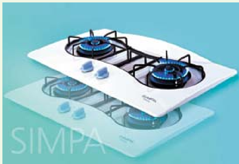
公司最近推出了專為香港大眾消費市場而設之「簡栢」爐具系列。

儘管如此，名氣廊在2003年之表現卻一枝獨秀，繼續透過廚藝工作坊、名人廚藝示範，以及美食活動，積極推廣優質生活藝術，因而獲得傳媒廣泛報道及各界輿論稱許。我們將於來年繼續強化