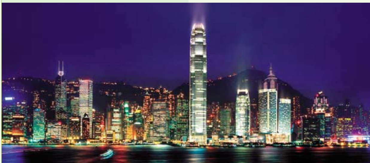
國際金融中心二期是香港之最新地標。這座全港最高之建築物不但標誌着香港之活力及正在復蘇之經濟，更突顯香港作為商業及金融中心之地位。

我們於年內推出以香港原創品牌為特色之「簡栢」爐具系列，再次突顯創意。「簡栢」針對大眾化市場，以「簡單」和「實用」為品牌定位，務求在價錢、設計及原創意念上均能緊貼市場需求。此