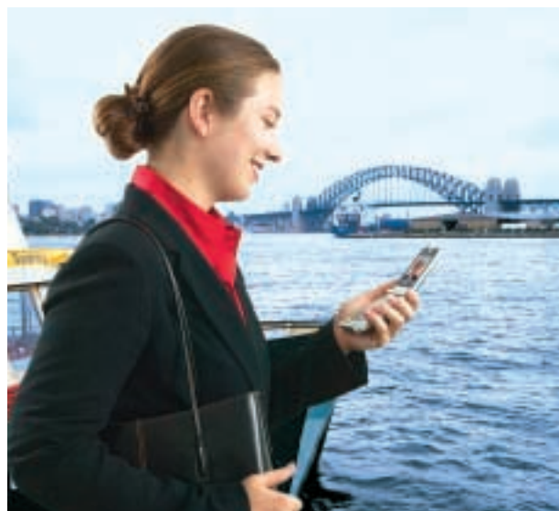
■ 澳洲的行政人員現在可透過「3」的服務，與身在澳洲或其他國家的客戶與同事「面對面」地洽談商務。

英國的業務繼續擴展網絡，二〇〇三年底已有逾五千個發射基組投入運作，覆蓋百分之七十人口，並透過與英國O 2 簽訂2G全國漫遊協議，把覆蓋率提高至超過百分之九十八。至今超過百分之六十六的所需資本開支已經支出。較早前3 UK宣佈推出「ThreePay」計劃，為客戶提