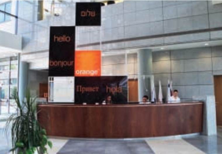
■ Partner Communications在特拉維夫總部的員工在早上開門營業前，準備就緒為客戶服務。

年第二季開始提供服務。二〇〇四年二月，集團在北方邦西部獲授統一接駁服務牌照，預計於二〇〇四年下半年推出GSM服務。