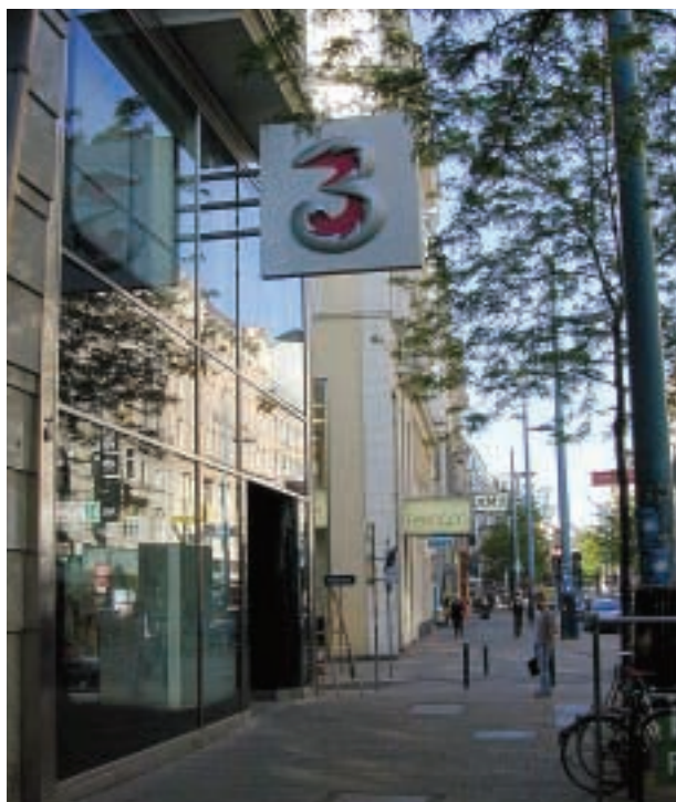
■ 集團在奧地利的3G旗艦店設於著名的購物大道Mariahilferstrasse上。