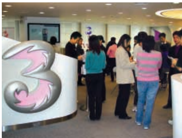
■ 3 香港的服務中心設計獨特，充分配合「3」多姿多采的流動視像通訊世界，讓客戶可以舒適地享用完善的顧客服務。

HI3G Access於九月獲授挪威3G牌照，代價六千二百萬挪威克朗（約港幣六千九百萬元），將發展成瑞典與丹麥3G業務的分枝。愛爾蘭與以色列的3G業務發展進度理想。