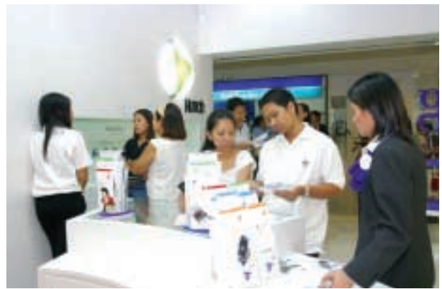
■ 在曼谷Hutch商店內，營業代表向客戶講解產品資料與推廣優惠。Hutch商店的服務理念，是要為消費者提供全面的多媒體通訊與優質售後服務。

集團於二〇〇三年二月在泰國推出CDMA2000 1X服務，至今已取得令人鼓舞的業績，客戶基礎至今已增長至超過四十六萬名。由於業務剛成立，因此錄得開辦虧損，但表現較預期為佳。大曼谷地區與東岸地區目前已推出「Hutch」品牌的服務，並於二〇〇四年擴展至西岸地區。