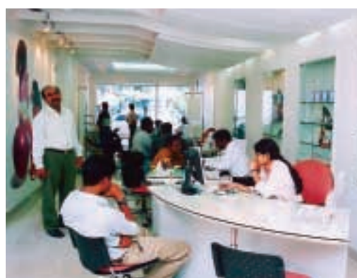
■ 集團在印度取得新服務牌照，將進一步擴展該國的網絡覆蓋。

集團在印度經營的2G電訊業務包括十個地區的GSM流動通訊業務約百分之四十九權益，計有在孟買的Hutchison Max Telecom；德里的Hutchison Essar Telecom；古吉拉特邦的Fascel；卡納塔克邦；安得拉邦與清奈市（「新南區」）的Hutchison Essar South；加爾各答的Hutchison Telecom East（「HTE」）和拉賈斯坦邦、哈里亞納邦、北方邦東部（「新北區」）的HTE附屬公司Aircel Digilink India（「ADIL」）。利息及稅前盈利錄得百分之一百七十四增長，反映在孟買、德里、加爾各答與古吉拉特邦現有業務的利息及稅前盈利有強勁增長。印度的流動電訊市場增長迅速，集團繼續在當地擴大客戶基礎，客戶人數攀升百分之一百四十，至今已超過四百八十萬名。二〇〇二年第二季，新南區以「Hutch」品牌推出服務，客戶人數增長百分之二百九十七，目前約共六十三萬七千名。於八月，與ADIL的合併計劃完成後，進一步加強新北區的業務。於十一月，集團在旁庶普邦取得第四個蜂窩式流動電話牌照，預計在二〇〇四