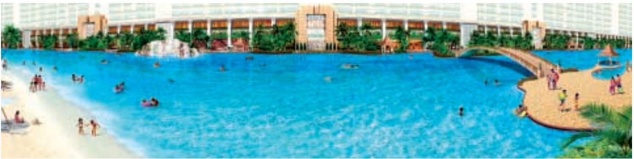
■ 藍澄灣設有二百米全港最長度假式會所泳池。