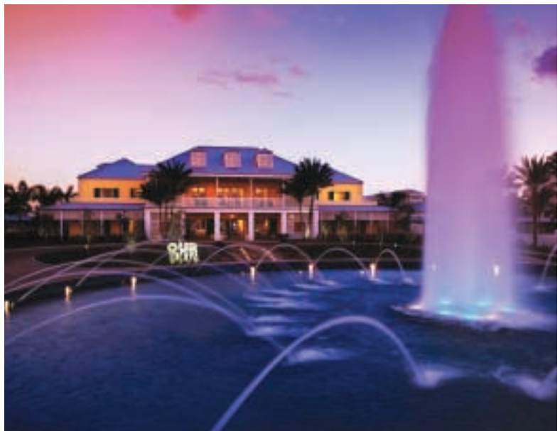
集團在大巴哈馬島The Westin and Sheraton at Our Lucaya Beach & Golf Resort酒店豪華大堂及酒店正門入口。