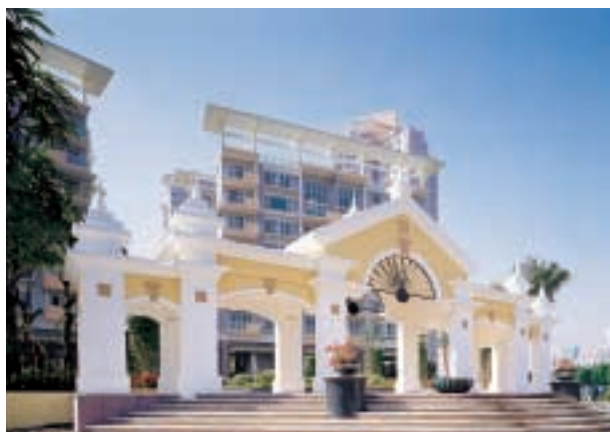
■ 深圳黃埔雅苑二期「逸悠園」的園林設計充滿西班牙色彩。

集團透過合資公司持有發展中的土地儲備，應佔約共一千六百一十萬平方呎，其中百分之十一在香港、百分之八十五在內地與百分之四在海外。這些項目預計於二〇〇四至二〇一五年分期完成，預料可為集團提供理想回報與發展溢利。