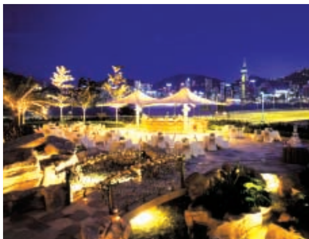
都會海逸酒店坐擁維多利亞港醉人景致。

雖然美國持續出現保安疑慮，令來自美國的消閒旅客人數偏低，但大巴哈馬島的The Westin and Sheraton at Our Lucaya度假酒店的業績仍有改善，利息及稅前虧損較上年度改善百分之三十。