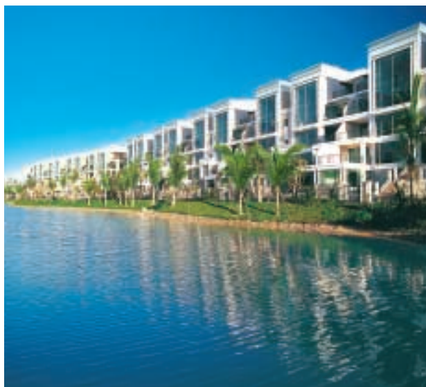
■ 珠海海怡灣畔設三萬平方米流線形人工湖，景致優美醉人。

位於上海的低密度住宅項目四季雅苑最後一期將於今年建成，該物業的大部分單位保留作出租之用。深圳寶安御龍居已於二〇〇三年推出預售，並已售出百分之二十四的住宅單位；該物業預計於今年稍後建成。御翠園最後數期、比華利豪園第二期、北京東方廣場餘下一座服務式住宅大樓和世紀商貿廣場預計於二〇〇四年建成，將為集團帶來發展溢利，並有助擴大集團的投資物業組合，其他發展中的地產項目進展良好。