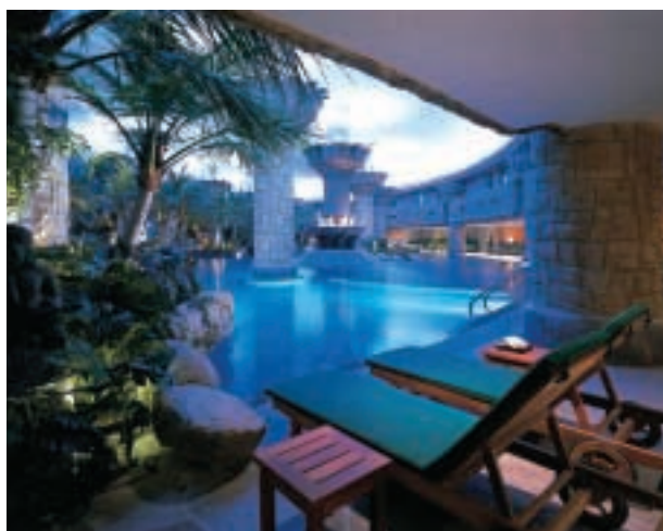
北京東方廣場內的巨型室內度假式游泳池，四周佈滿翠綠的熱帶植物，並配以能幻變出二十多種不同氣象的虛擬天幕，令人歎為觀止。