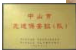
中山市先進保安隊