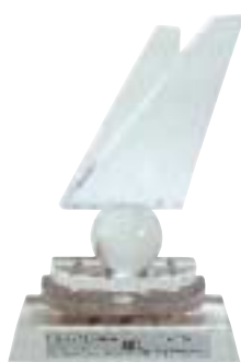
Certificate of Appreciation for Fiscal Year 2002 日本航空

SARS爆發後，星晨旅遊有限公司（「星晨旅遊」）迅速地實施連串削減成本措施，以保存現金資源。於二零零三年五月二十三日世界衛生組織解除對香港之旅遊警告後，為振興境外旅遊業務，星晨旅遊隨即以極具競爭力之價格推出一系列精選境外旅行團。星晨旅遊外遊部之業務量（以外遊旅客計）於第三季迅速回復至正常水平。業務量經過上半年出現相當跌幅後於下半年強勁回升，以致二零零三年整年之外遊旅客數目僅較去年之數字略為下跌。