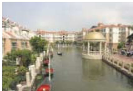
中山星晨花園第七期 水城威尼斯