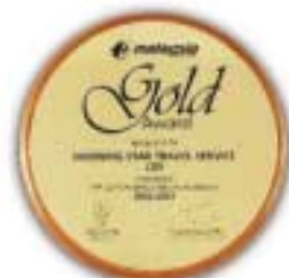
Gold Award 2002/2003 馬來西亞航空