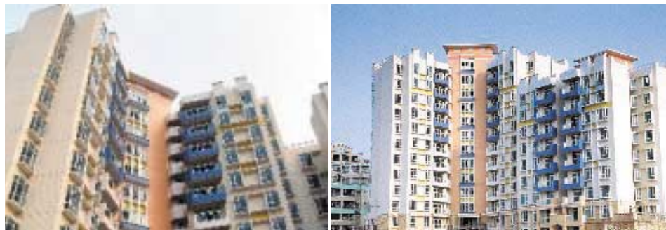
星晨廣場西地塊「續城」

有關以當地買家為目標之中國中山星晨廣場（「星晨廣場」），西地塊第一及第二部份「續城」之預售單位已於二零零三年九月推出。反應令人鼓舞。