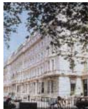
Corus hotel Hyde Park 倫敦

截至二零零三年十二月三十一日止年度，本集團擁有69.5%權益之澳洲附屬公司Morning Star Holdings (Australia) Limited（「MSA」）錄得未經審核綜合除稅後虧損140,000澳元（約730,000港元），而二零零二年則為溢利110,000澳元（約480,000港元）。於二零零三年十月售出其位於澳洲之最後一項酒店物業後，MSA積極在澳洲尋找新投資機會。