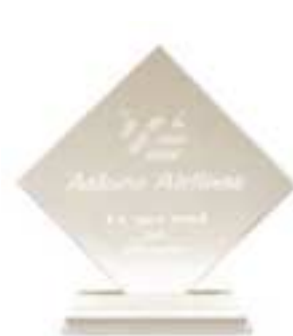
Top Agent Award 2002 韓亞航空