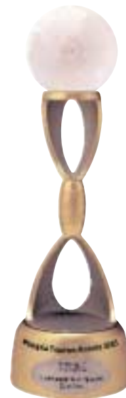
Malaysia Tourism Awards 2003 — Best Foreign Tour Operator (East Asia)

出口業於二零零三年維持穩健發展。失業率於七月份錄得8.7%之新高，其後於二零零三年十二月回落至7.3%。負資產業主數目於二零零三年六月急升至約106,000名，其後於二零零三年底下降至約68,000名。通縮情況逐漸緩和。