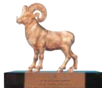
SIA Top Agent Award Hong Kong 2002/2003 星加坡航空

在此艱困及競爭劇烈之營商環境下，星晨旅遊繼續優化其服務、旅遊產品及品牌的質素。鑑於此方面之努力，星晨榮獲香港超級品牌頒發之「榮譽獎項超級品牌香港2004」榮譽，並連續三年榮獲馬來西亞文化、藝術與觀光部頒發之「Malaysia Tourism Awards 2003 – Best Foreign Tour Operator (East Asia)」。於二零零三年，星晨旅遊亦榮獲多間主要航空公司之獎項，包括馬來西亞航空之「Gold Award 2002/2003」、國泰航空之「2002 Top Agent Award」、日本航空之