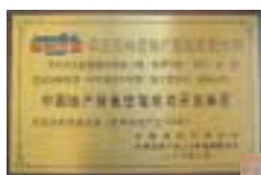
中國地產綠色住宅 成功開發典範