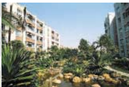
中山星晨花園第六期