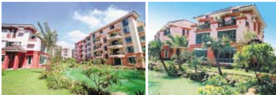
中山星晨花園 第八期佛羅倫斯

於中國中山之星晨花園(「星晨花園」)第八期佛羅倫斯之第一部份建築預期於二零零四年下半年落成。截至現時為止，星晨花園第一至第七期超過96%單位經已售出。