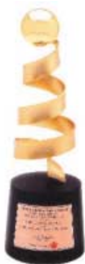
2002 Million Dollar Sales Award 中華航空

經歷充滿挑戰之二零零三年後，星晨旅遊錄得營業額較二零零二年下跌25%。在嚴緊控制經營開支下，與二零零二年比較，星晨旅遊成功減少其總經營開支8%。整體而言，本集團之旅遊部於二零零三年錄得經營虧損7,600,000港元（二零零二年：溢利4,500,000港元）。