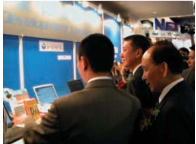
澳門特別行政區行政長官何厚鏞先生參觀本集團在澳門資訊週2003設置之攤位。

在收購事項完成後，本集團繼續全力支持科技業務之研究及開發工作，以擴大其產品種類及提升其交易解決方案軟件；由於不斷提升軟件；以及其所提供