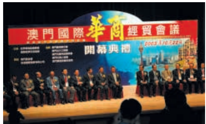
滙盈加怡金融集團贊助澳門國際華商經貿會議2003。

本集團於二零零三年二月五日完成收購滙盈，並拓展其業務範疇，其中包括開始為地區及國際性客戶於香港及海外證券交易所、資本市場提供廣泛的投資銀行及金融服務，以及提供企業融資顧問服務。收購事項為本公司之一項關連及須予披露交易，並已取得獨立股東之批准。有關收購事項之詳情分別於本公司於二零零二年十月十二日及二零零二年十一月十六日刊發之公佈及通函內提述。