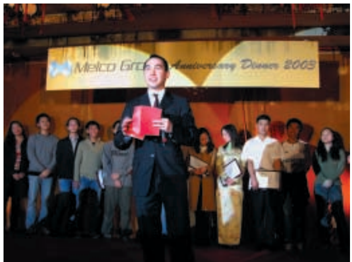
何猷龍先生於本集團二零零三年週年晚會上宣佈(年度僱員獎)。

本集團所有之成員公司均為提供平等機會之僱主，而本集團以職位的適合程度作為委聘／擢升所有僱員的依據。僱員薪酬及有關福利乃按相關表現為基準計算，而本集團之一般酬金標準均於每年由管理層進行審核。本集團亦不斷為僱員提供培訓計劃。