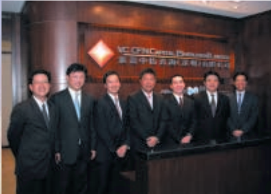
滙盈加怡金融集團之高級管理層人員出席深圳辦事處之開幕典禮。

非典型肺炎疫情於二零零三年上半年對市場投資氣氛及本集團之經紀業務造成不利影響，然而，自二零零三年六月開始非典型肺炎退卻後，股票市場氣氛漸見復甦。例如，恆生指數自二零零三年六月起攀升約31%至二零零三年十二月底之12,575點。與此同時，香港股票市場(包括創業板)每日平均市場成交量，由截至二零零三年六月三十日止六個月約71億港元增加至截至二零零三年十二月三十一日止六個月約136億港元。由於股票市場之交投量上升，本集團之投資銀行及金融服務業亦因而受惠，並取得重大改善。經紀及期貨業務於二零零三年十二月三十一日止六個月期間之總營業額，較二零零三年二月五日至二