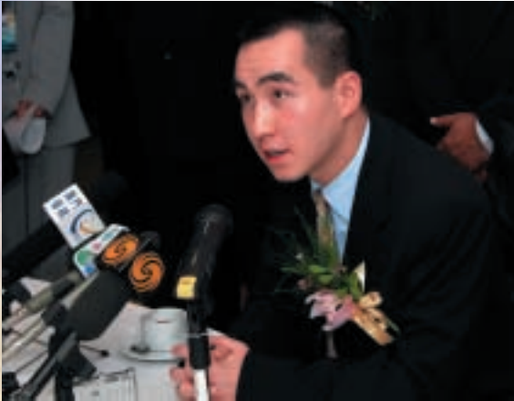
新濠集團董事總經理何猷龍先生出席本集團澳門總部開幕典禮的記者招待會。

於二零零三年，本集團業務成功邁向另一個新里程，透過收購滙盈控股有限公司（前稱亞洲網上交易科技有限公司）（「滙盈」）（於香港聯合交易所有限公司創業板上市之公司）之67.57%權益（「收購事項」），將集團業務拓展至投資銀行及金融服務及科技業方面。