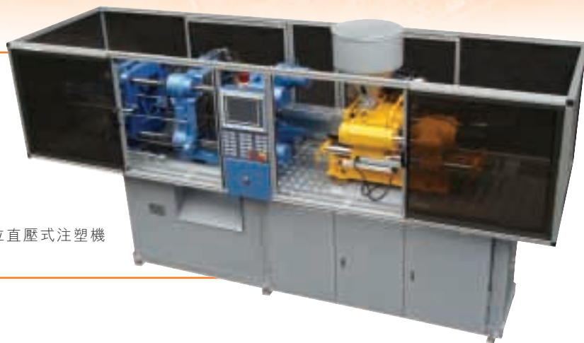
高速復位直壓式注塑機

疫症期間，由於不少內地客戶面對嚴控物流措施致零部件供應失控而處於半停產狀態，以致集團的塑膠注塑業務受累。在困境的壓力下，我同事們積極開發新客戶，疫情過後，客戶網群更見健全且步入旺景，營業金額對比往年上升16%。唯塑膠價格的波動，使本年度的業績不理想，盈利有所下降，但對二零零四年的盈利恢復，集團保持樂觀。