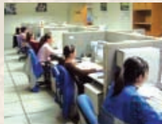
呼叫中心團隊提供一流服務