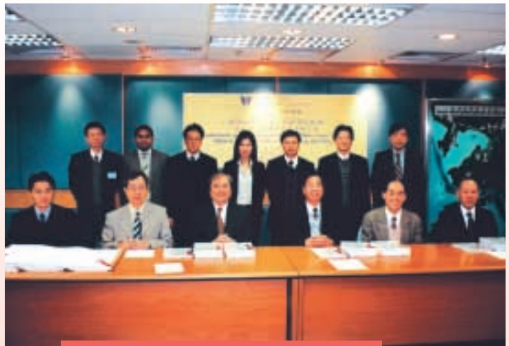
獲水務署頒發管道翻新工程簽約典禮

Norditube為免挖掘技術之專家，於環形編織襯管及應用材料上均具有廣泛的專業知識。Norditube壓力管道技術得到歐洲及美國的認可，亦於香港廣泛應用。年內在東莞設立該生產線的廠房使Norditube進一步改善其產品價格，以配合亞洲、歐洲及美國需求的增加。RibLoc為螺旋式纏繞膠管管道技術的先鋒。其技術大大節省了非壓力管道翻新及安裝新管道於物料、運送及安裝上的成本。以他們的經驗及網絡，彼此攜手合作下，本集團將能迅速地擴展業務至歐洲及美國市場。