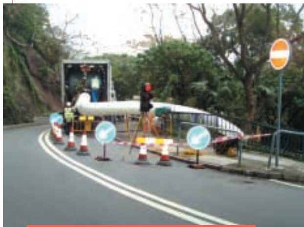
於淺水灣使用“Phoenix Pipe Liner”為一條直徑600毫米的水管進行更新工程

過去數年，本集團於新加坡之附屬公司完成了差不多接近100公里之管道翻新工程。他們寶貴的經驗將能與其他國家組員分享。年內，除了非政府部門的合約以外，香港的附屬公司亦直接或間接地成功獲得多項水務署、渠務署、路政署、香港房屋委員會及香港機場管理局的工程合約。手頭合約總值高達港幣二億元。本集團期望客戶將繼續接受傳統開鑿式以外之新的管道翻新技術，此業務將成為本集團一項重點的工程業務。