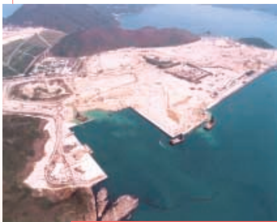
將軍澳海港發展之海堤及填海工程

於二零零四年三月三十一日，建築及土木工程部門手頭上之工程合約總值接近港幣530,000,000元。主要的合約包括新界天水圍國際濕地公園、新界元朗舊墟十六區之中、小學的承建合約及新界天水圍一零四區類似的承建合約。學校的承建合約進展順利，預期於二零零五年完成。年內已完成的主要土木工程合約包括將軍澳海港發展一三七區第二期之興建海堤及填海工程及佐敦道第三期填海及餘下工程。