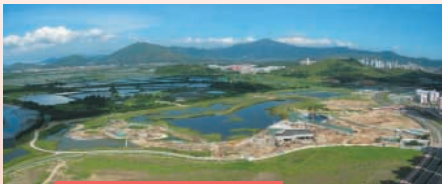
位於新界天水圍國際濕地公園建築工程

於二零零四年三月三十一日，建築及土木工程部門手頭上之工程合約總值接近港幣530,000,000元。主要的合約包括新界天水圍國際濕地公園、新界元朗舊墟十六區之中、小學的承建合約及新界天水圍一零四區類似的承建合約。學校的承建合約進展順利，預期於二零零五年完成。年內已完成的主要土木工程合約包括將軍澳海港發展一三七區第二期之興建海堤及填海工程及佐敦道第三期填海及餘下工程。