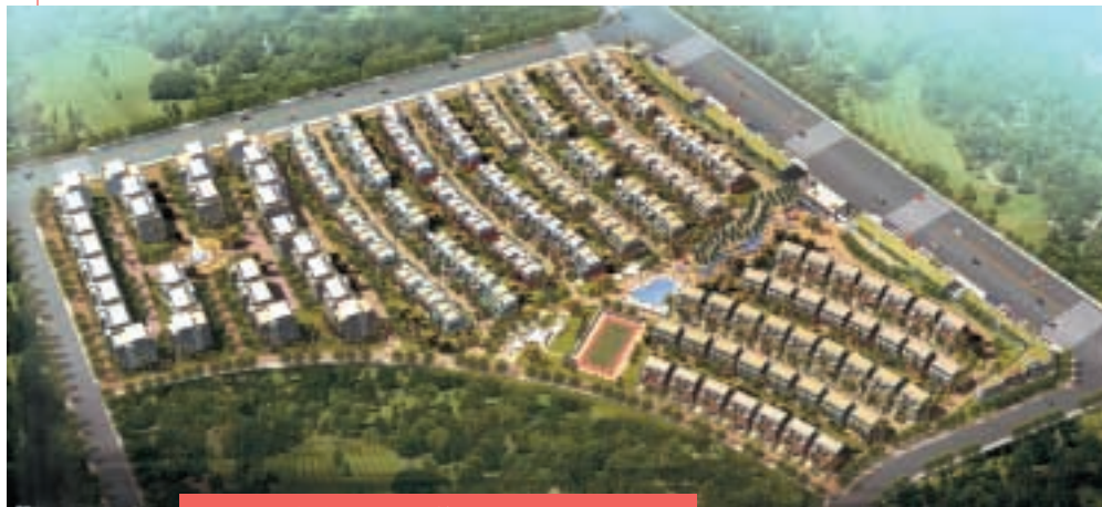
內地豪華住宅物業－翠擁天地二期