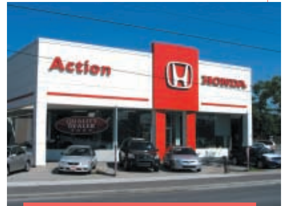
加拿大 Action Honda 汽車代理

年內，Action Honda連續四年榮獲本田優異代理獎。此項由加拿大本田頒發的獎項表揚表現優異的汽車代理。然而，由於競爭激烈，去年汽車代理的經營溢利減少。至於美國西岸的東方食品貿易、入口及分銷業務，於年內維持理想表現。本集團並獲得多個受到美國市場歡迎的知名食品品牌獨家代理權。