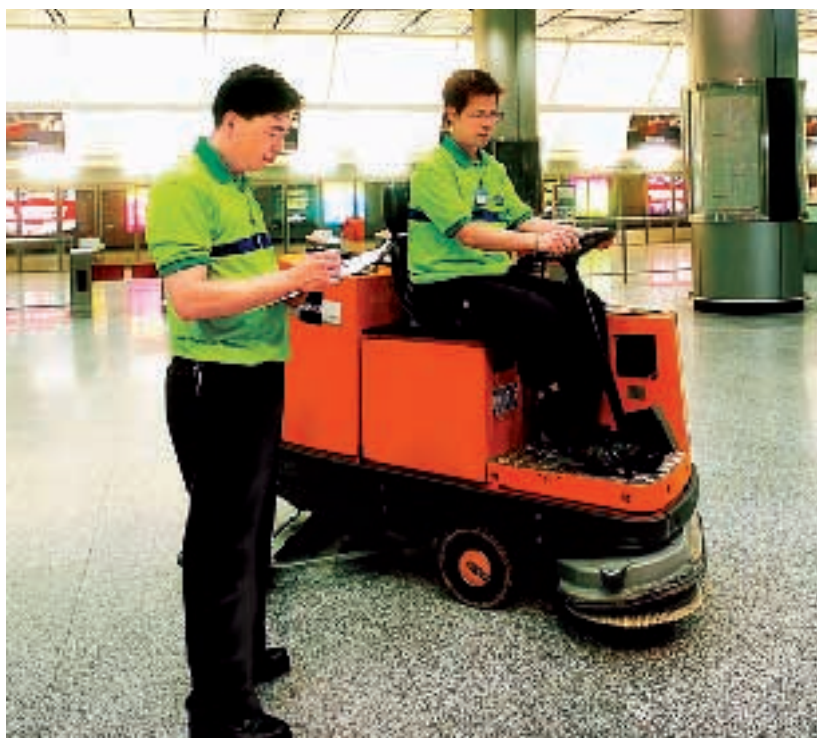
惠康清潔滅蟲有限公司

非典型肺炎疫潮結束後，香港之經濟於2003年下半年迅速復甦。憑藉中央政府的大力支持，諸如簽署更緊密經貿關係安排及放寬內地人民訪港的旅遊限制等措施，香港大部分行業均因經濟復甦而受惠。