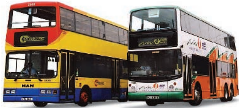
城巴有限公司及新世界第一巴士服務有限公司

本集團將繼續審慎管理香港的服務業務，同時在中國內地服務業務各範疇物色商機。本集團致力