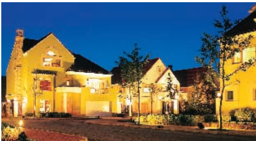
僑樂物業服務(中國)有限公司管理的北京麗高王府

設施管理業務方面，本集團亦正積極開拓中國內地市場，策略包括提供園藝及種植服務、洗衣服務以及物業管理及代理服務。