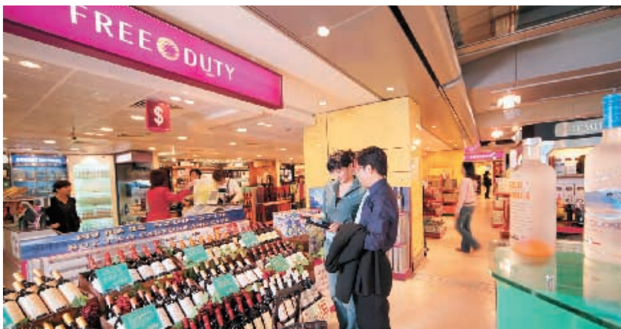
天傳有限公司經營之免稅店

惠康清潔滅蟲有限公司（「惠康清潔」）及寶聯防污服務有限公司（「寶聯防污」）的業績均大幅增長，溢利分別較2003財政年度增長38%及29%。惠康清潔成功奪得香港國際機場等著名優質客戶的新合約，而寶聯防污亦成功與香港特區政府續訂重要的清潔合約。