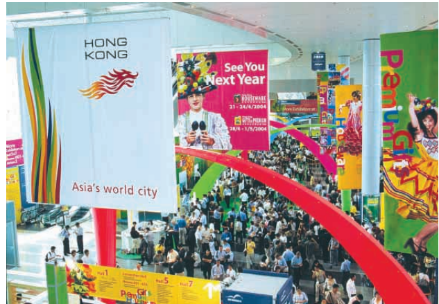
由新創建服務業部門負責管理的香港會展中心，每年香港最大的貿易展覽，均多在此舉行。