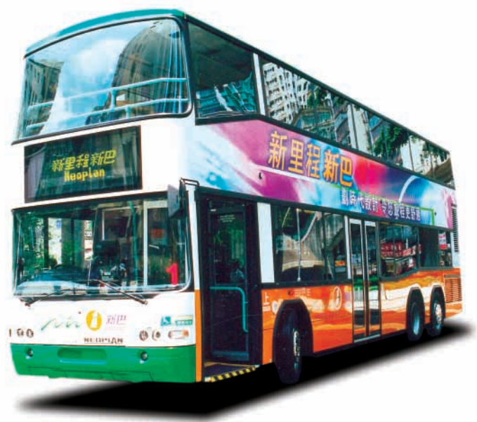
新世界第一巴士所屬的Merryhill乃新創建旗下的合營公司，在香港經營廣泛的巴士及渡輪服務網絡。

本集團投資於昆明的巴士服務業務，於2004年初開業後，已即時帶來盈利貢獻。對昆明公共運輸業務進行直接投資，反映我們發展跨境投資的決心。