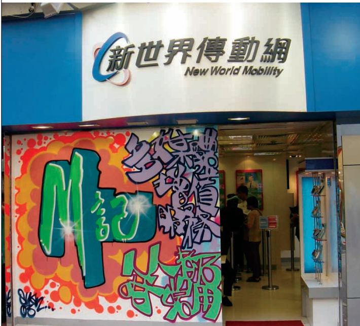
新世界傳動網把旗下的多媒體增值服務，納入「M記」服務品牌。