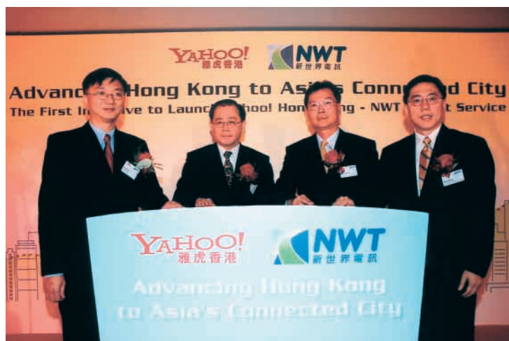
新世界電訊與雅虎香港合作推出支持本地商戶的計劃，並公佈有關服務推出，舉行儀式。

擴建數據及寬頻網絡、配置無線接入技術、增建網上話音郵件、傳真郵件及電子郵件服務綜合平台等項目，將需作出資本開支。