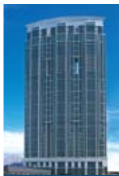
君臨天下 The HarbourSide