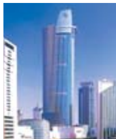
恒隆廣場 Plaza 66