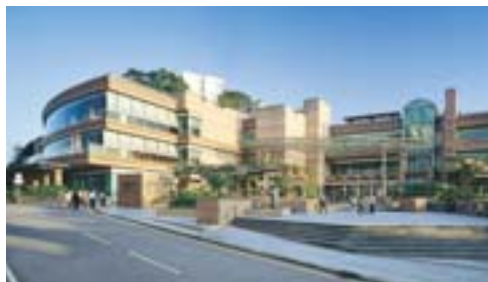
山頂廣場 The Peak Galleria