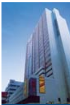
栢裕商業中心 Park-In Commercial Centre