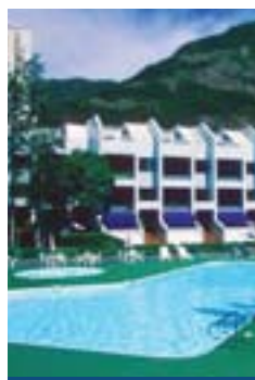
濱景園 Burnside Estate