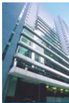
印刷行 Printing House