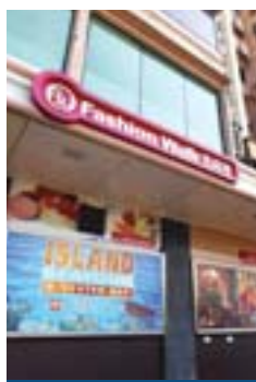
名店坊 Fashion Walk