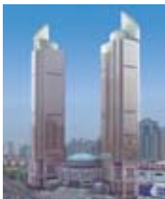
港匯廣場 The Grand Gateway