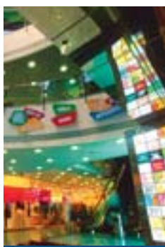
格蘭中心 Grand Centre