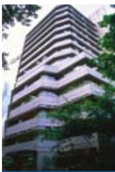
樂成行 Baskerville House