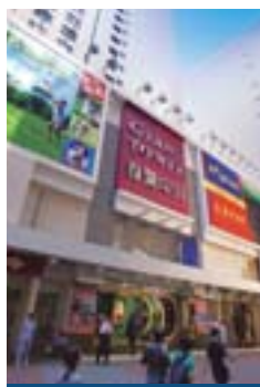
雅蘭中心 Grand Tower