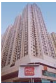
淘大商場 Amoy Plaza