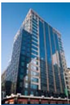
樂基中心 Stanhope House