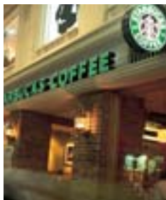
名店廊 Fashion Island