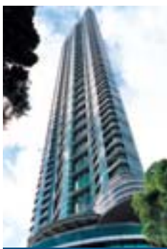
御峰 The Summit