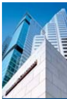
渣打銀行大廈 Standard Chartered Bank Building