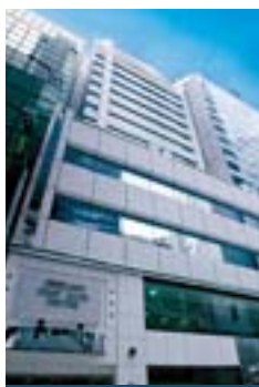
浙江第一銀行中心 Chekiang First Bank Centre