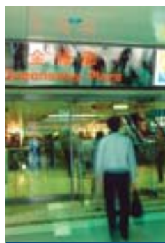
金鐘廊 Queensway Plaza