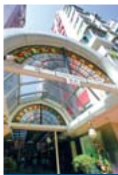
食街 Food Street