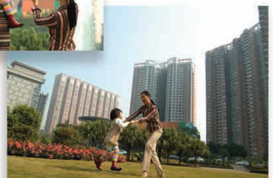
東風廣場 — 理想居庭