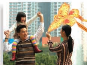
溫馨家庭生活盡在東風廣場