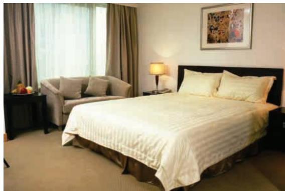
酒店服務式公寓 — 睡房

為140,000平方米，包括辦公樓、商場，以及附設多元化會所設施之酒店式服務公寓（共356個單位）。自一九九七年底開業以來，香港廣場成功吸引到不同類型之著名商場租客，如滙豐銀行、中國銀行、舒適堡、采蝶軒、肯德基家鄉雞、味千拉麵、華潤勵致洋行傢俬及賽博數碼廣場等，更成為眾多尊貴企業租戶之辦公室及酒店式服務公寓之首選。於回顧年度，酒