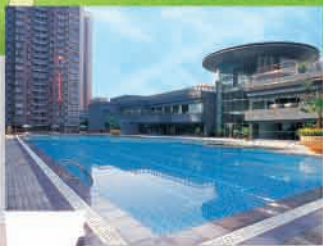
東風廣場 — 住客會所及設施