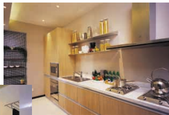
示範單位 — 廚房