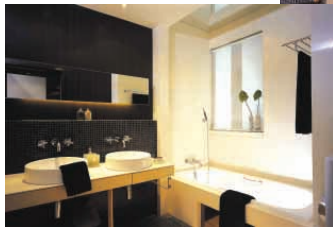
示範單位 — 浴室

第一至五座之預售許可證已於回顧年度內取得，並於二零零三年十月開始預售，銷售成績令人鼓舞。截至二零零四年七月三十一日止年度，第一至五座共407個單位已售出360個。在獲頒預售許可證及簽署買賣協議後，有關營業額及溢利已逐步確認入賬。第七座之預售許可證已於二零零四年九月發出，而第六座之預售許可證將於稍後發出。