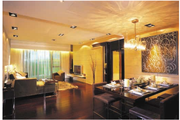
示範單位 — 客廳及飯廳

本集團另一重點項目位於上海市著名的長寧區，鄰近中山公園地鐵站，佔地36,000平方米。於落成後，凱欣豪園社區將包括13幢住宅大廈，總樓面面積約達156,000平方米，另提供約14,800平方米之商業範圍，附設住客會所及其他設施。凱欣豪園由屢獲殊榮的知名專業團隊負責設計，使之成為達到國際級水平及獨一無二的優質住宅項目。園內包括經過精心規劃、匠心獨運、景致怡人之庭院佔地共15,000平方米，專為豪華住宅而設之空中花園及設備先進之電影院。項目第一期預期於二零零五年落成，包括七幢住宅大廈（第一至七座）共約1,000個單位。