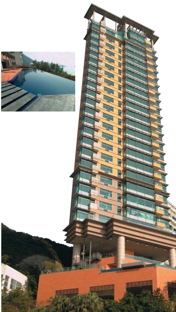
淺水灣道117號 Grosvenor Place