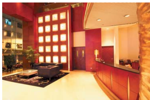
九龍皇悅酒店大堂

酒店業績自去年中期報告期間開始反彈，營業額及溢利分別達287,000,000港元（增加58%）及17,000,000港元，而去年同期之營業額及虧損則分別為181,000,000港元及19,000,000港元。