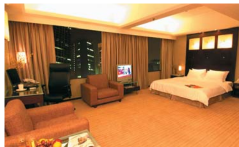
香港皇悅酒店行政套房

億人口及東南亞逾5億人口必到旅遊熱點，我們相信酒店業及旅遊業前景極為美好。同時加拿大方面已獲得二零一零年冬季奧運會主辦權，預期當地業務亦將進一步增長。