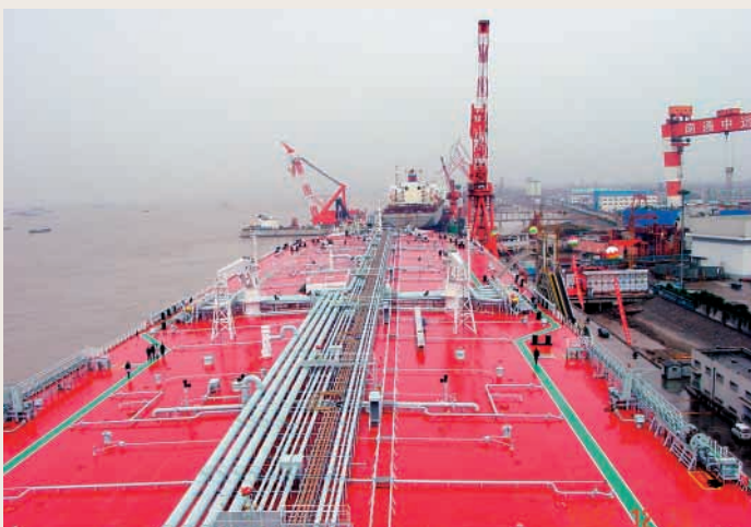
船舶備件及設備服務是本集團日後發展重點之一

中遠國際根據中遠集團總公司的發展戰略，積極落實核心業務定位，努力開拓船舶服務業。二零零四年，隨著全球經濟漸趨復蘇及中國內地強勁經濟增長，航運市場發展更興旺，圍繞航運相關的船舶服務業也迅速發展。中遠國際在中遠集團總公司及中遠集團系內各公司的配合及支持下，成功併購多個與船舶服務業相關的公司，逐步組建包括船舶貿易、船舶保險顧問、塗料、船舶用設備及備件供應為主的船舶服務供應平台（有關各併購項目內容詳閱「副主席報告」及「業務回