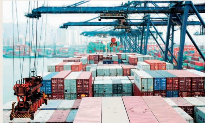
高效的船舶服務提升船隊競爭力

今後，本集團將會繼續落實以船舶服務為核心業務的定位，充實及拓展以達至成為一站式船舶服務供應平台；致力成為具有競爭優勢、專業獨特的全球性船舶服務供應商。