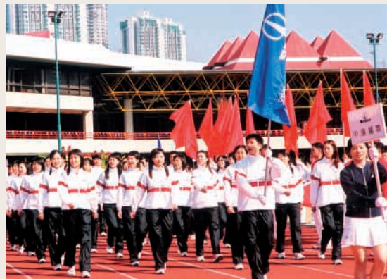
一支優秀的團隊是企業持續發展的動力來源

在拓展業務的同時，本集團也非常重視企業文化建設及人才素質的培育及發展。在結合中遠企業