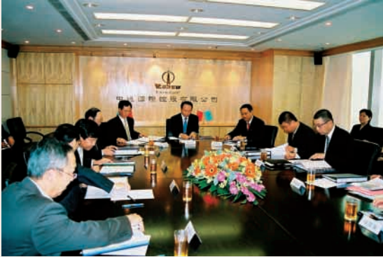
加強企業管治是董事會重點工作之一

核准通過成立薪酬委員會、提名委員會、執行委員會、風險管理委員會及投資委員會，全面強化企業的管治架構，完善各種規章制度，建立制度化的管理體制，維持企業高效優質的管治水平，確保持續的創效能力。