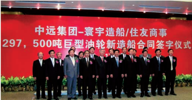
中遠國際致力為中遠船隊提供全面的船舶服務

美國則為4%，雖然受原油價格高企及美國聯邦儲備局增加息率等因素的影響，預期二零零五年全球經濟發展會略為放緩，但中國的經濟發展將會持續領先。本集團相信在強勁外貿運輸帶動下，與航運業相關的船舶業務將會繼續受惠。