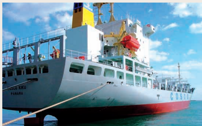
船舶保險顧問為船舶提供財產及責任保險的中介服務

經過了一系列的收購後，本集團已初步構建起以船舶代理服務為起始點的業務供應平台。利用船舶貿易代理業務擔任開墾者的角色，本集團爭取為船東及租船人提供合適的船舶買賣、船舶備件及物料供應、船舶保險顧問、船舶技術、融資及估值等代理服務，作為與船東及船廠建立長期緊密合作關係的起步點，同時充分發揮和利用現有船舶服務的資源優勢，將不同的船舶服務資源貫連起來，發揮協同效應，達到更大的效益。