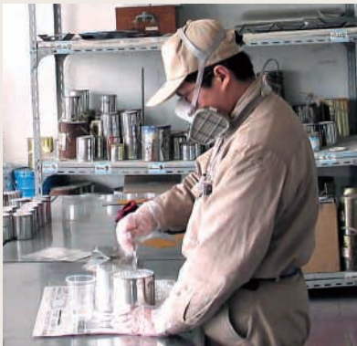
塗料品質控制檢測

展望未來，中遠國際將會繼續落實業務策略定位，鞏固及拓展現有核心業務，在外拓市場、內強管理的發展策略下，本集團將全力抓緊機遇，利用協同效應，將現有資源轉化為向外拓展的無限資源，提升企業持續發展及核心競爭能力，積極建立跨地域、跨業務的船舶服務供應平台，爭取成為市場的熱點，為企業創造更高效益，為股東帶來更大的價值。