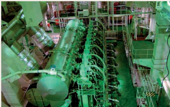
船舶設備及備件供應具有龐大發展空間

航運業是跨地域、全球性的業務，要構建穩固的船舶服務平台，必需建立跨地域式的網絡服務資源系統，為船舶提供安全、可靠及高效率的服務。本集團洞悉船舶服務市場未來龐大的發展需求，故此，繼二零零三年收購天津中遠關西塗料化工有限公司及上海中遠關西塗料化工有限公司（「中遠關西公司」）各63.07%股權後；年內本集團再收購廣州經濟技術開發區廣遠海運服務有限公司與挪威佐敦合資的廣州佐敦遠洋制漆有限公司（「廣州佐敦」）49%股權，拓展了中國船舶塗料及集裝箱塗料供應及銷售市場。在依托中遠集團擁有龐大的船隊及集裝箱的優勢下，中遠國際將會結合國際性合作夥伴的專業技術和網絡資源，積極建設中國以至全球各地港口完善的船舶服務供應網絡，為世界各地的船隊提供全方位的船舶供應服務。