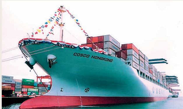
船舶服務業佔本集團營業總額57%

二零零四年，本集團雖然進行了一系列新項目的投資，但銀行貸款與總資產比率為32%(二零零三