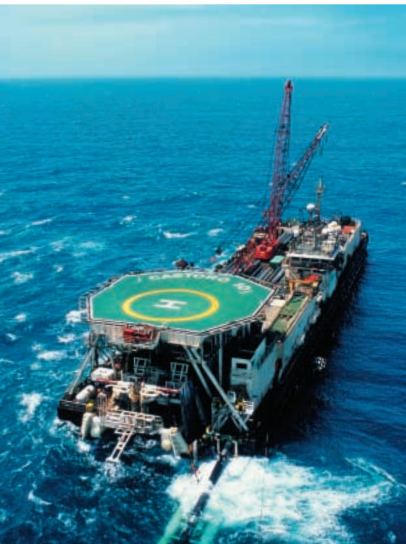
這艘鋪管船正在為香港電燈鋪設連接深圳與南丫島的天然氣管道，以便日後為渦輪燃氣機組供氣。

南丫島發電廠第九台新機組預期於二零零六年投產，有關項目的進展持續理想。首台三百兆瓦發電機組