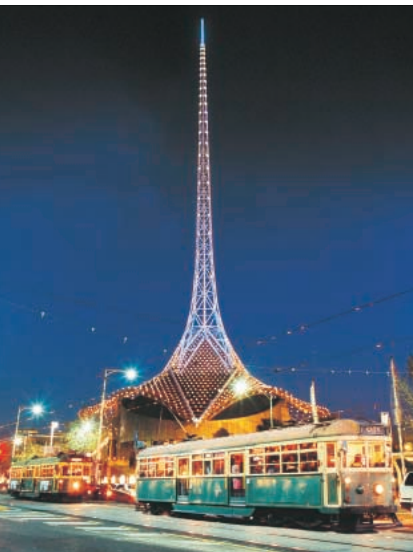
CitiPower是澳洲最可靠的配電網絡，輸送源源不絕的電力，令墨爾本的藝術中心頂尖閃閃發亮。