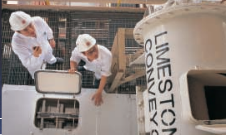
香港電燈的煙氣脫硫裝置減少二氧化硫排放。