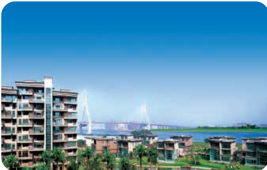
● 廣州珊瑚灣畔前臨珠江景致，河道縱橫，水天一色。