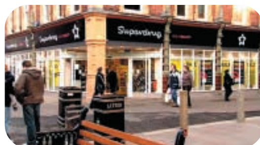
● Superdrug 為英國第二大保健及美容產品連鎖店，提供質價兼優的多元化日用品及品牌貨品，在英國享有價廉物美的盛譽。