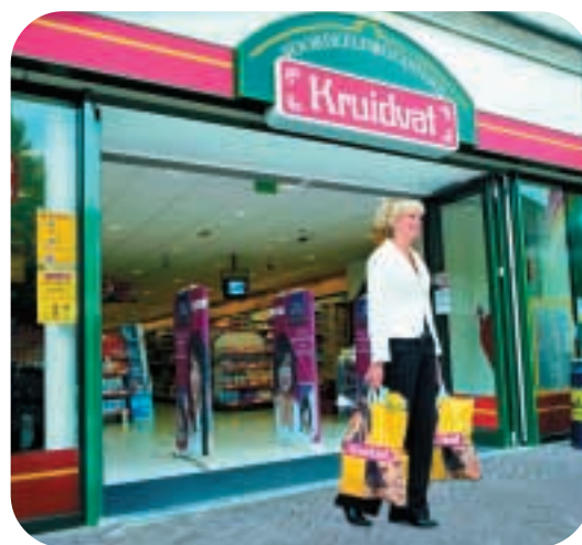
● Kruidvat 在荷蘭仍然維持其在保健及美容產品市場的領導地位。

在歐洲，保健及美容產品業務的總銷售額和EBIT分別較去年增加百分之二十四和百分之八，主要因為Kruidvat的銷售表現改善，而且二〇〇四年收購的Drogas和Dirk Rossmann也帶來盈利貢獻。該部門繼續在歐洲擴充業務，於年內開設二百一十六家新店和收購八百六十九家商店。為進一步加強在歐洲的業務發展，屈臣氏集團於六月份收購波羅的海國家的保健及美容產品零售連鎖集團Drogas，該公司共有八十三家零售店。同年八月，集團行使於二〇〇二年透過收購Kruidvat而取得的認購權，收購Dirk Rossmann百分之四十權益。Dirk Rossmann經營保健及美容產品零售連鎖業務，在德國設有七百八十六家分店。截至目前，屈臣氏集團在英