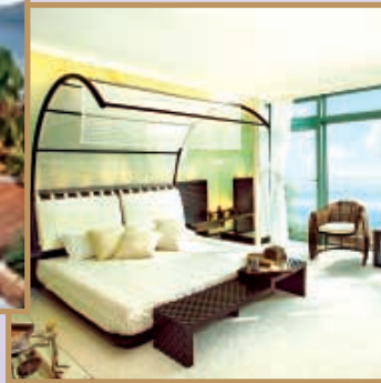
Lively Contemporary Thai styled house. 清新脫俗的時尚泰式擺設家居。