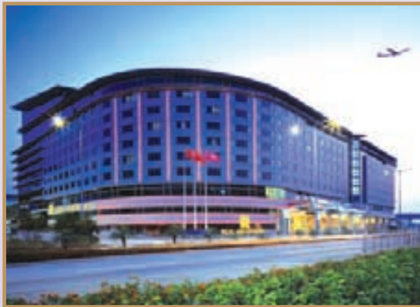
The 1,000 square meter pillarless Grand Ballroom is the largest hotel ballroom in Hong Kong. 面積達1,000平方米之無柱式大宴會廳乃香港最大型之酒店宴會廳。