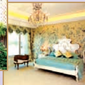
House decorated with English Country style. 英國鄉郊式之華麗佈置。