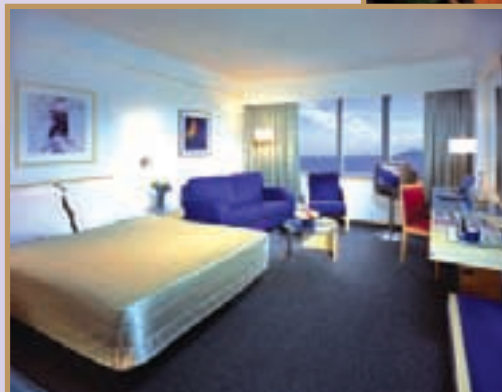
Spacious suites and guestrooms, well furnished and delicately planned. 套房及客房佈置優美，設置細意安排，空間寬敞。