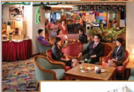
Perspective of the new hotel lobby. 酒店大堂的新面貌（透視圖）。