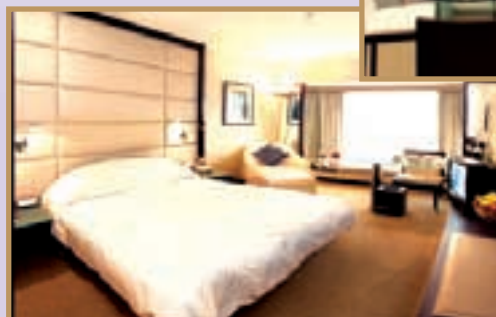
Renovated suites and guestrooms on Regal Club Executive Floor, well-appointed and gracefully furnished.