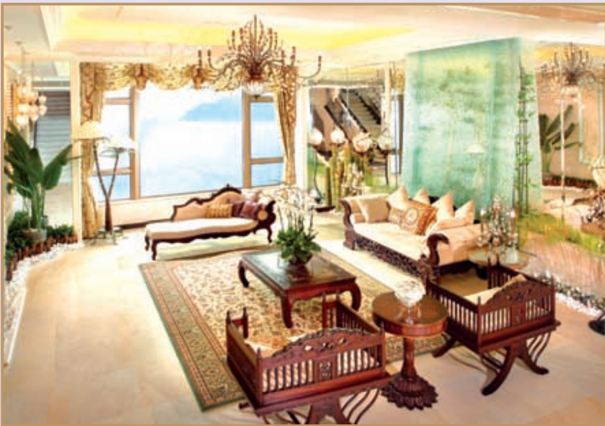
House full of Oriental Romance . 全屋充滿東方浪漫色彩。