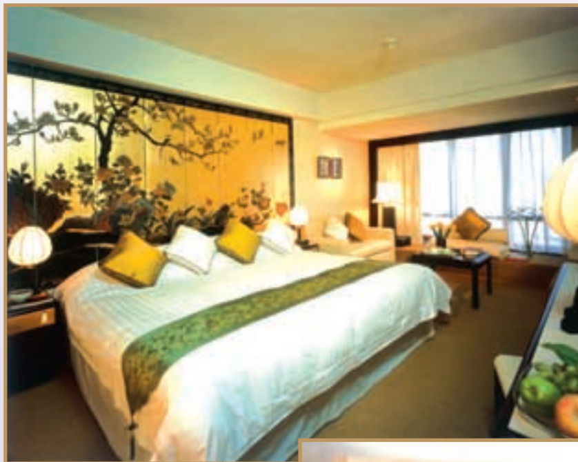
Deluxe room refurbished and filled with oriental culture. 客房裝修華麗，充滿東方文化氣色。