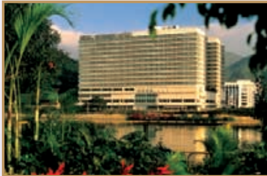
A city-resort hotel that offers a relaxing ambience. 環境清幽雅緻，恬靜怡人，乃城市中之度 假式酒店。