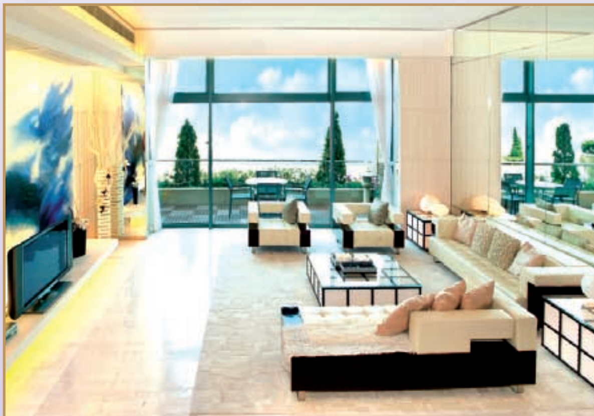
Elegant Contemporary Japanese styled house. 時尚日式設計，簡潔舒適。