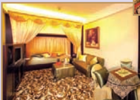
Theme suites decorated with different country themes being well received by hotel guests. 主題套房配以不同國家風情，深受酒店顧客歡迎。