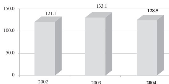
ZONE亞洲*的營業額 (百萬港元)

於二零零四年，ZONE新加坡之收益及收入錄得續年之增長。其繼續招攬部份具規模之企業客戶，並成功取得多項向政府部門及半官方機構提供IDD及其他電訊服務之合約。服務平台提升工程如期於二零零四年完成，以建立更為穩健之系統及提供其他增值服務。