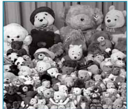
蘋果基金搜集了超過120隻玩具熊，給殘障兒童作聖誕禮物