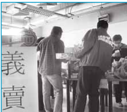
壹傳媒的團隊成員舉行慈善拍賣，為海嘯災民籌款

壹傳媒對員工所承擔的高度承諾，是本集團持續吸引出版業最優秀人才的主要原因之一。因此，加入壹傳媒不僅為職業上的選擇，更是能於充滿幹勁的工作環境下工作的通行證。在壹傳媒這個大家庭，積極進取的人士既可追求自己的夢想，又可提高公眾對直接影響社會上每項人和事的認識。