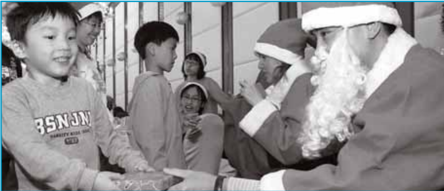
蘋果基金「聖誕老人派禮物行動」