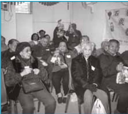
蘋果愛心月餅行動，共有逾6,000人受惠