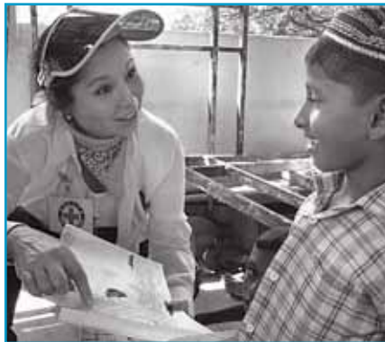
蘋果基金贊助「香港紅十字會」派員前往探望受海嘯影響的小孩