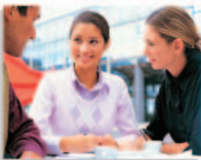
集團在香港及美國兩地均推行了實習生計劃

一直以來，偉易達為香港的大學及專上學院學生提供暑期實習生計劃，讓他們親身體驗工作實況。於二零零五財政年度，集團在香港和美國兩地均推行了實習生計劃。