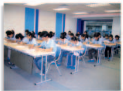
員工正在接受培訓課程

作為跨國企業，集團的市場遍佈全球，因此掌握多種語言能力，對員工的日常工作日益重要。集團於二零零五財政年度舉辦英語及普通話課程，以配合員工在這方面的培訓需要。此外，電腦軟件及演講技巧課程亦深受努力自我增值的員工歡迎。