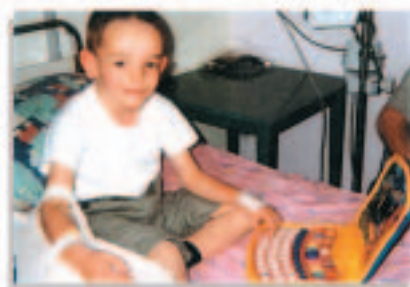
偉易達捐贈總值100,000歐元的產品和銷售點物資予法國多家公立醫院

二零零四年六月，偉易達在法國使用電郵進行社區關懷活動，結果非常成功。集團按聯絡名單發出電郵，鼓勵消費者登入www.vtechfrance.com網站，每次登入，偉易達則捐贈價值相等於1歐元的玩具予法國的醫院病童。消費者踴躍響應，令集團在3個星期內便已達到100,000歐元的目標，把總值100,000歐元的產品和銷售點物資捐贈予法國多家公立醫院。