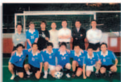
偉易達員工參加由畢馬威會計師事務所舉辦的五人足球賽

集團舉辦多項聯誼活動，以加強員工的團隊精神及鼓勵創意思考，並提高員工的積極性。二零零五財政年度內，香港員工參加公司舉辦的多個旅行團，包括1天海上遊、3天澳門旅遊，並於復活節假期到中國內地旅遊等。海外辦事處亦舉行聖誕派對和家庭野餐會等消閒活動，而中國內地廠房則舉行周年派對，以及足球和橋牌比賽等。