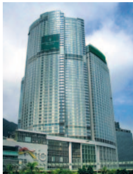
為香港站四季酒店安裝升降機、電扶梯及玻璃幕牆工程

機機組、為石湖墟污水處理廠供應及安裝燃氣發電機機組、為大埔污水處理廠第五階段第一期供應及安裝機電設備、紅磡灣酒店項目的電力系統安裝及澳門永利渡假村二十層高的酒店進行機械安裝工程。建築及土木工程部門繼續精簡人手以維持效率，成功為該部門於年內轉虧為盈，惟邊際利潤依