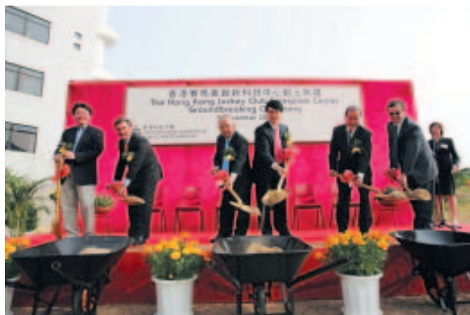
為香港科技大學興建香港賽馬會創新科技中心

然偏低。其主要工程合約包括為香港科技大學興建香港賽馬會創新科技中心，以及為英基學校協會在沙田馬鞍山興建國際學校和在新界元朗第十二區興建一所小學。而位於新界元朗舊墟第十六區的中、小學承建工程進展順利，預期在二零零五年年中完成。