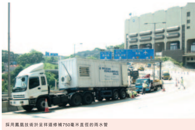
採用鳳凰技術於呈祥道修補750毫米直徑的雨水管

管道技術部門表現良好，營業額及盈利均達到目標。所有管道翻新業務於二零零四年年底已納入「其士管道科技有限公司」（「其士管道」）名下。集團成功重整業務，並將其士管道發展成為環球管道翻新工業之領導者。本集團亦分別增持