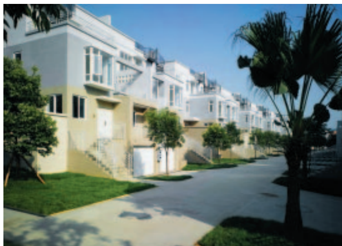
位於中國成都的豪華住宅物業－翠擁天地二期