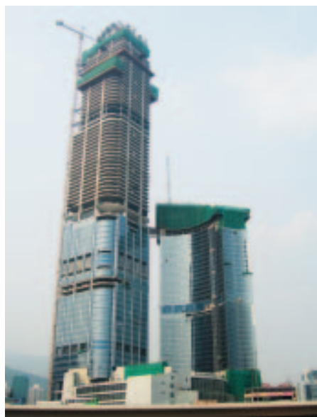
為如心廣場安裝升降機、電扶梯及玻璃幕牆工程

元，盈利則為港幣160,000,000元，相比去年增加11%。整體盈利與營業額的比率則由8.8%減至7%。假使建築及土木工程部門撇除在該業務之外，猶如在2003/2004年度進行私有化前不綜合於本集團的財務報表內，該業務整體邊際利潤則接近上年度的表現。