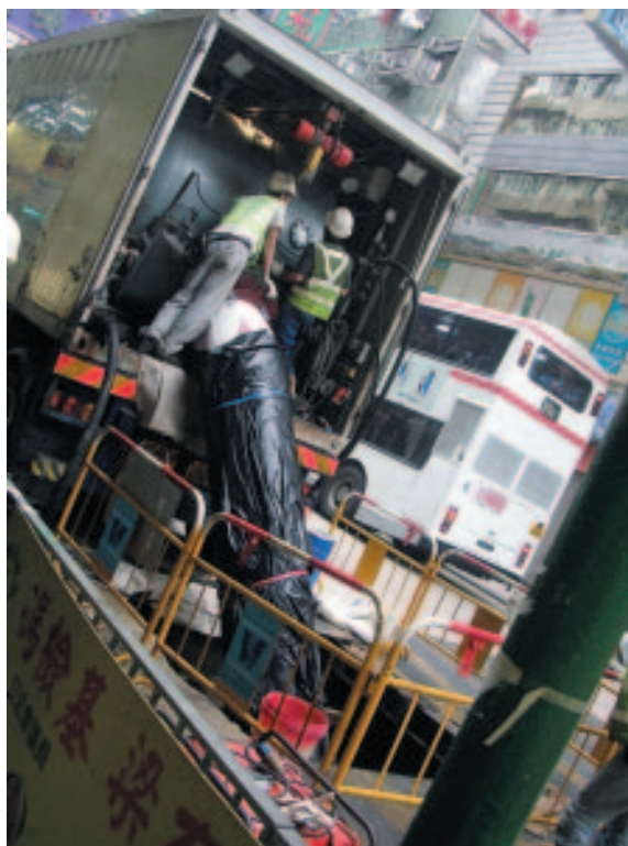
修復一條位於青山道直徑為600毫米的食水管

年內，投資市場波動而不明朗，導致投資業務盈利下降。然而，有賴本集團採用審慎及保守的投資策略，投資回報跌幅並不顯著。投資組合約60%為定息收入投資工具、高息票據、銀行存款及其他固定收入的投資，其餘為股票及基金。本集團將繼續其審慎的投資策略及維持均衡的投資組合，以確保穩定的收入來源。