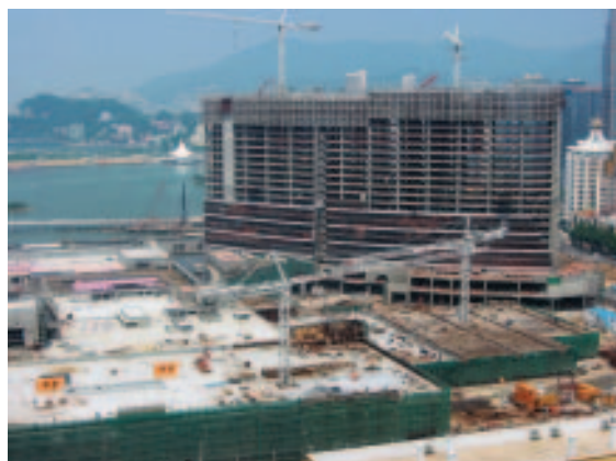
為澳門永利渡假村酒店進行機械安裝工程