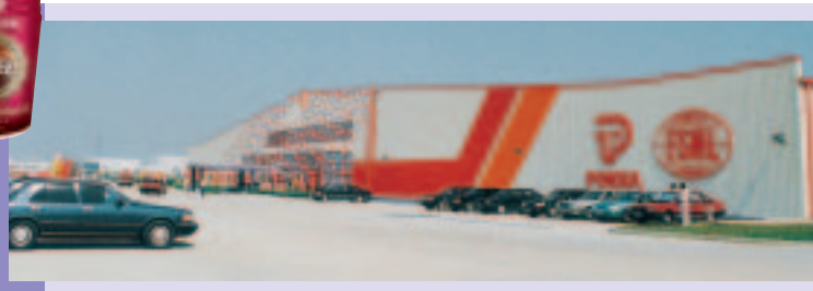
百佳四洲食品(蘇州)有限公司