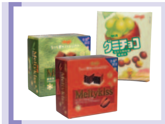
日本明治製菓生產之橡皮糖及雪吻朱古力

「2004香港超級品牌」，成為零食專門店中的名牌，提供喜愛零食的消費者必到的地方。