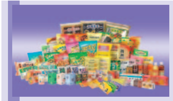
四洲品牌產品系列

四洲品牌之產品不但質優，且物超所值，深受市場歡迎，曾榮獲多項國際認可之獎項，包括四洲紫菜榮獲「2004上海十大值得品嚐的休閒食品」、權威評審機構頒發「2002香港超級品牌」、「亞洲優秀金牌獎」、「2002香港十大名牌」、「2002年香港超市十大品牌」及「第一品牌」等獎項。