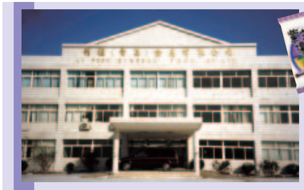
利福(青島)食品有限公司