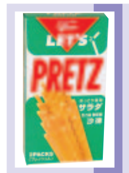
日本固力菓生產之百力滋餅乾條

港市場領導地位，業務保持增長。並設立零食專門店「零食物語」引進最新的潮流零食；零食物語更獲頒發