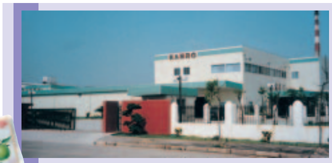
甘樂四洲食品(汕頭)有限公司