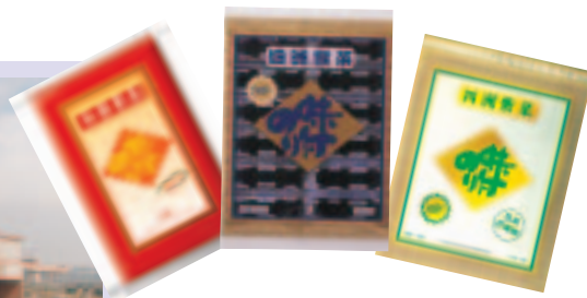
你口四洲(汕頭)有限公司