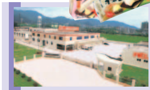
廣東四明燕塘乳業有限公司

品已成為業內的典範，屢獲殊榮，繼獲得「全國質量信得過食品」、「質量信得過企業」及「連續榮獲香港Q唛優質產品標誌證書逾10年」等榮譽外，今年