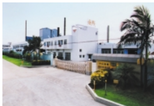
位於中國中山之工業積層板廠房之正門

此外，本集團努力維持生產廠房之良好管理質量，以鞏固競爭力。本集團於中山、東莞及泰國之三間廠房均實施質量保證系統，並獲得ISO9001:2000質量認證。