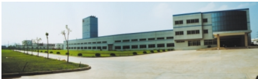
位於中國蘇州之 新工業積層板廠房

工業積層板業務為本集團之主要業務，於截至二零零五年三月三十一日止年度錄得營業額176,000,000港元。該業務之整體毛利率由截至二零零四年三月三十一日止年度之4.8%，顯著上升至回顧年度之11.8%。