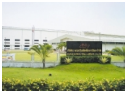
位於泰國之銅箔製造廠

為應付激烈競爭，於回顧年度內東莞廠房購置額外生產配件及機械，以提高生產力及效率。因此，此業務之整體毛利率由二零零四年之20.9%上升至二零零五年之24.6%，而二零零五年之分類業績亦由二零零四年之25,400,000港元躍升至42,100,000港元。