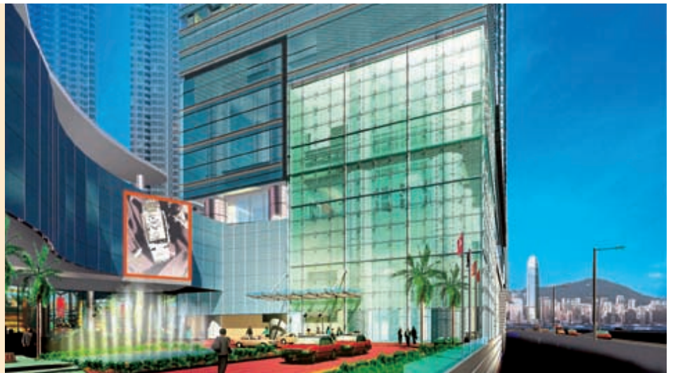
九龍站發展項目第一期的住宅物業及服務式住宅正在興建中。