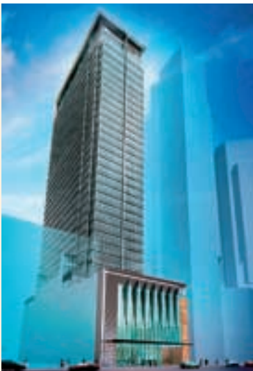
創紀之城六期將為集團在東九龍增添優質寫字樓。

項目將包含二百五十萬平方呎頂級寫字樓、一百萬平方呎住宅及服務式寓所，另有一百萬平方呎酒店及九十萬平方呎購物商場。落成後，該項目將包括一幢全港最高的大廈，設備超現代化和先進，切合現代商業租戶的需要。第一期超過七十萬平方呎住宅和服務式寓所的上蓋工程現正進行。