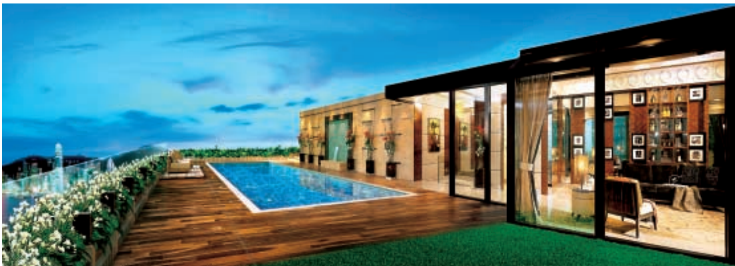
豪華住宅凱旋門的天際獨立屋位於七百呎高空，坐擁一望無際的維港景色。

集團將繼續按進度推售新項目，未來九個月內將推售的項目包括山頂倚巒、奧運站君滙港、馬灣珀麗灣第五期和荔枝角曼克頓山。