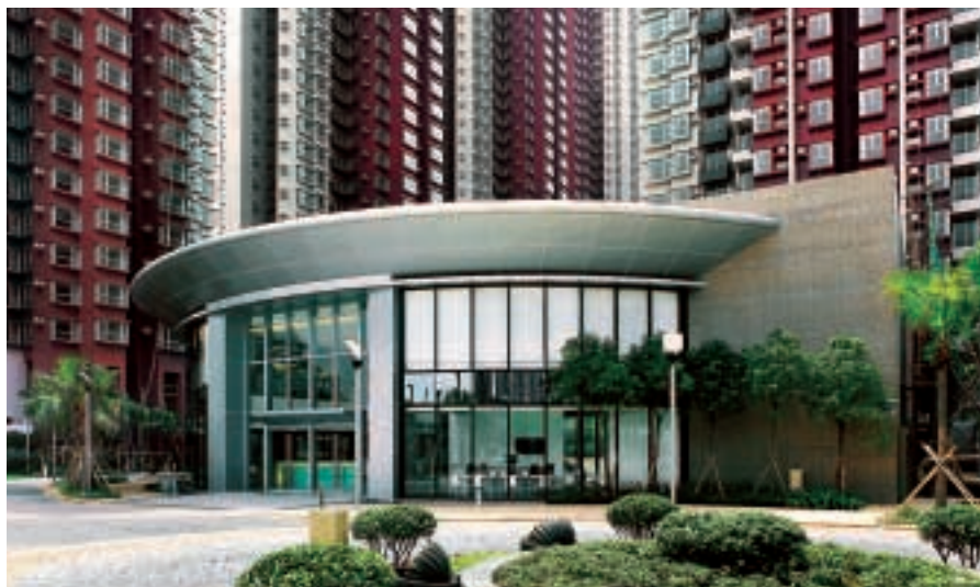
高級住宅項目元朗YOHO Town，設有完善住客會所和偌大綠化花園。