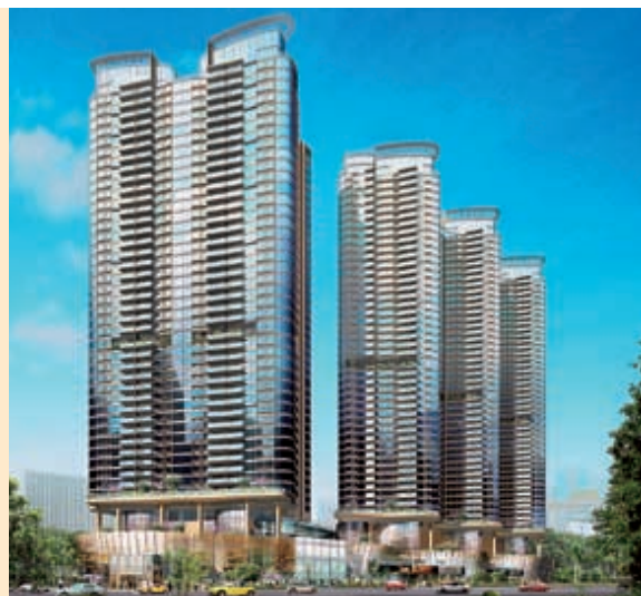
新蒲崗項目將在區內開創豪宅新水平。