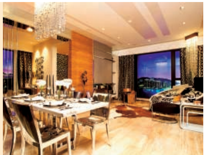
酒店式服務住宅荃灣爵悅庭，間隔多元化，並提供酒店式服務，滿足住客需要。