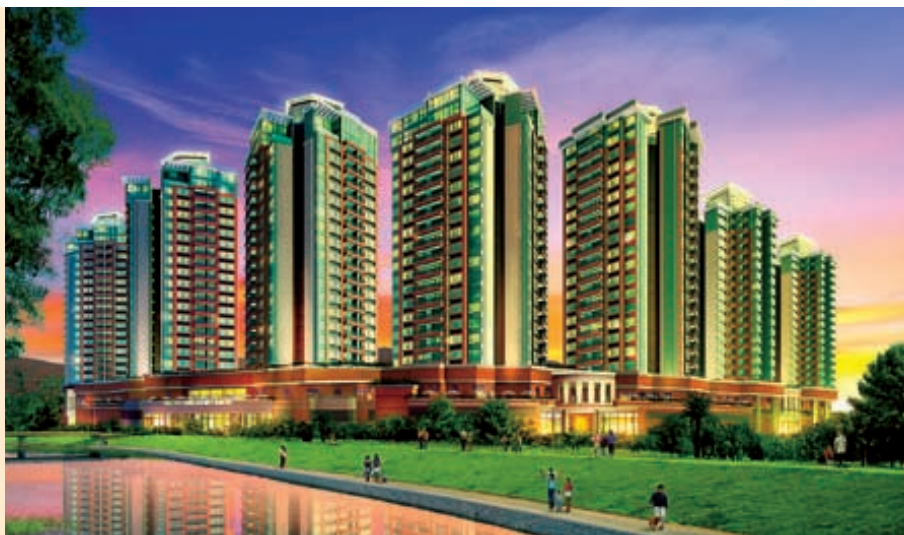
上水皇府山綠樹環抱，擁有便捷交通連接中國內地。

珀麗灣第五期及第六期工程經已展開，兩期合共包括九座低至中密度的住宅，建於環境優美的島上，亦將是珀麗灣最後一期的住宅發展。