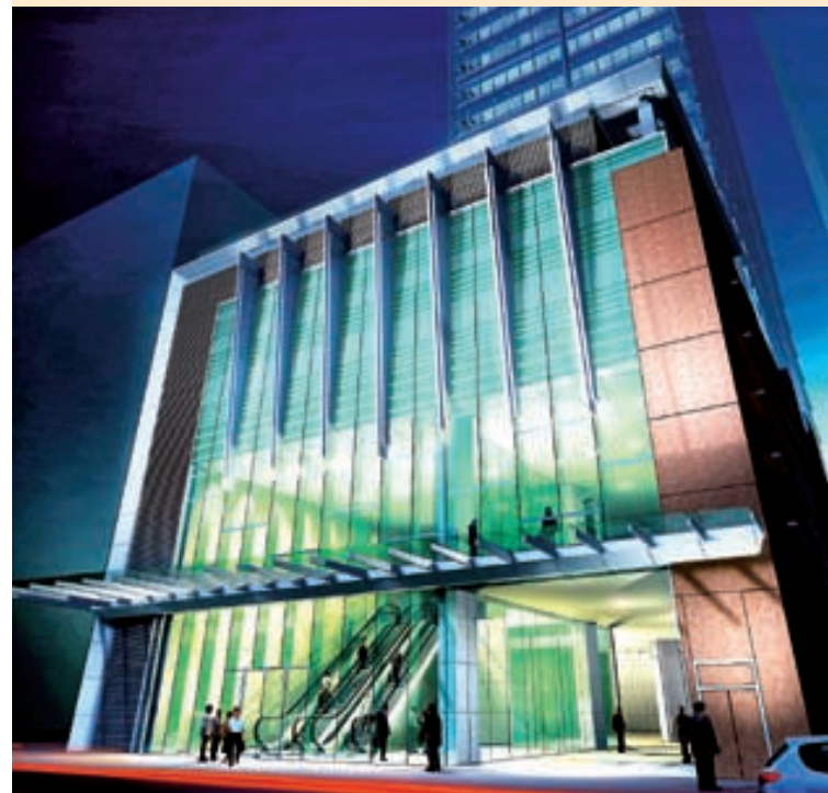
創紀之城六期憑著尖端設施，將成為東九龍頂級寫字樓。