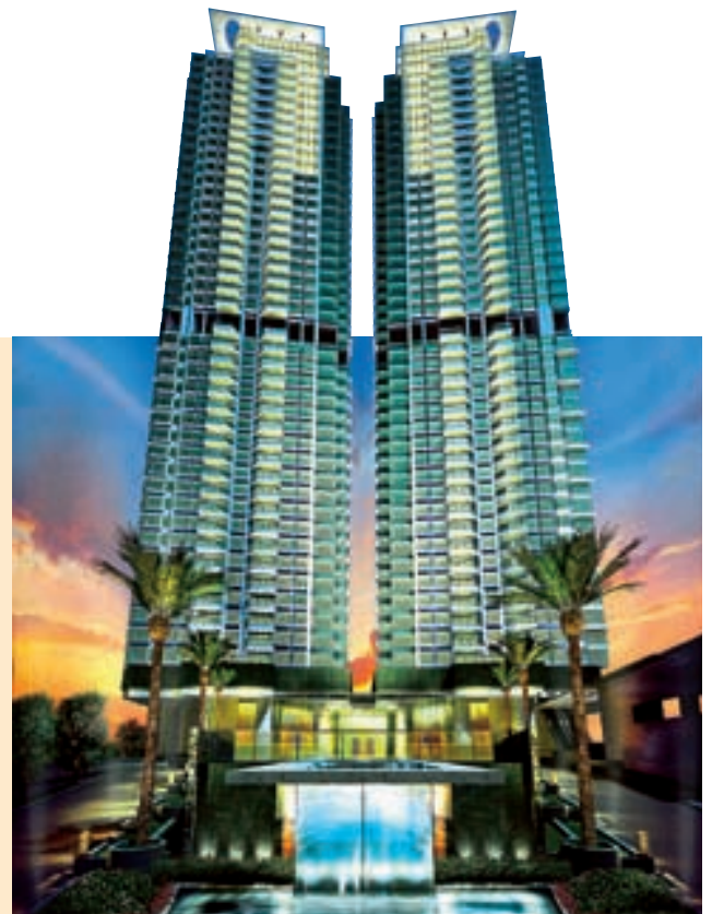
奧運站君滙港為現代都市人創造優越的生活模式。