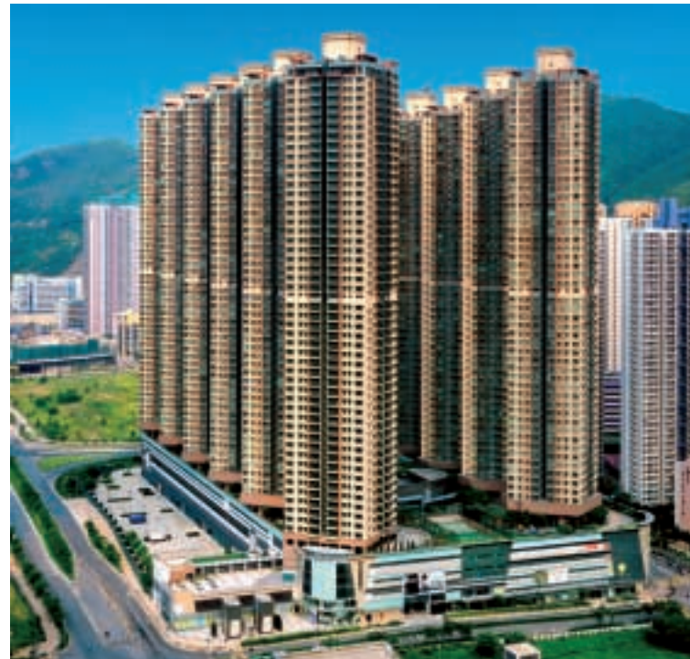
位於將軍澳的將軍澳豪庭單位間隔多元化，交通便捷。