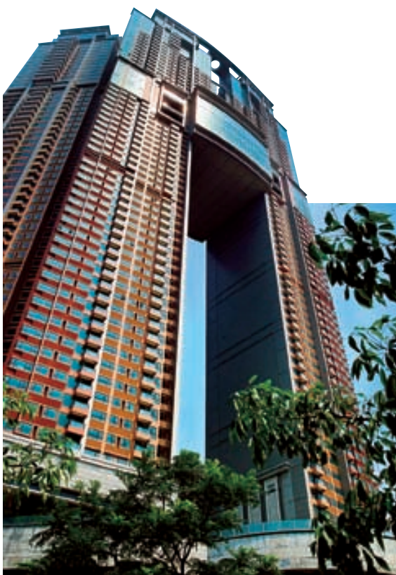
九龍站凱旋門外型矚目，成為維港海旁新地標。

凱旋門於二〇〇五年四月推售時，反應非常熱烈，逾百分之九十單位已售出。憑著獨特的建築設計，該優質項目將成為九龍海旁的新地標。建築工程將於二〇〇五年年底完成，預期於二〇〇六年上半年交樓。