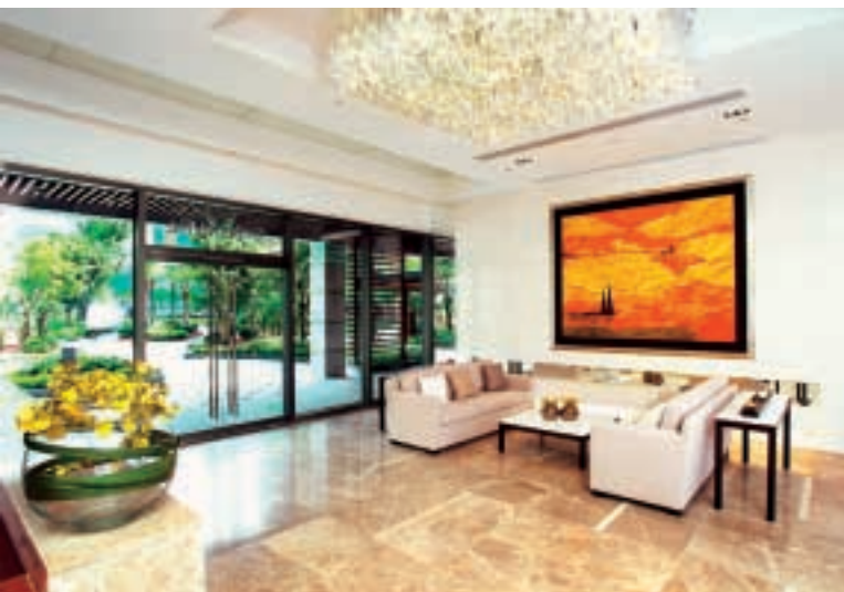
屯門聚康山莊為住戶提供舒適寫意的居住環境。