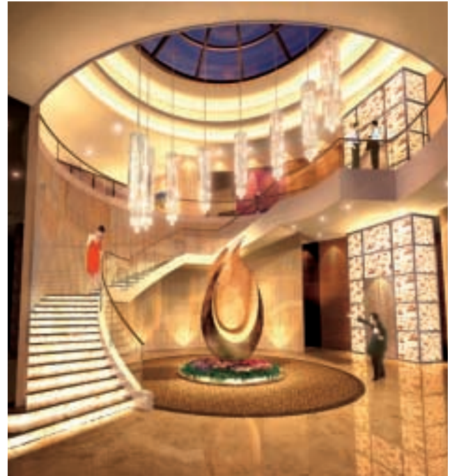
上水皇府山的豪華會所，散發高貴的氣派和格調。

本年度集團共完成約三百一十萬平方呎供銷售的住宅項目，並計劃在未來三年，每年平均完成二百七十萬平方呎住宅物業。憑著集團的強大品牌和市場利好走勢，有助提高邊際利潤及集團的盈利能力。