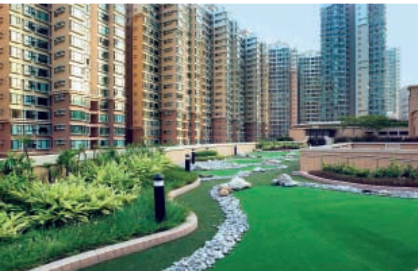
珀麗灣天然景色優美，是馬灣獨一無二的住宅物業。

項目由三幅位置接近的土地組成，集團於二〇〇四年初已完成轉換土地用途，計劃提供總樓面面積六十九萬一千平方呎低密度豪華住宅單位。地盤平整經已完成，地基工程即將展開。