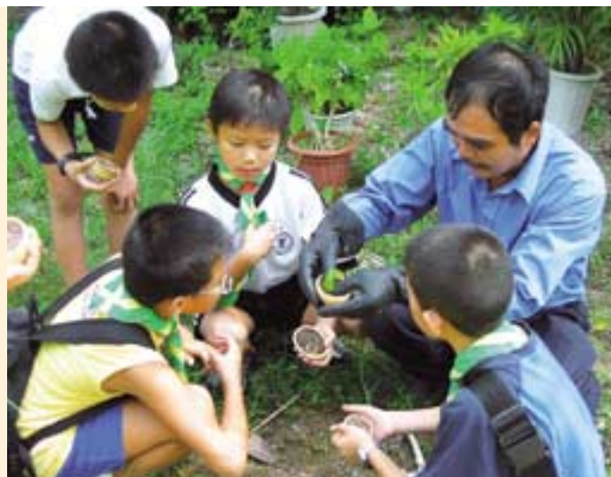
華景山莊的職員向兒童示範種植薄荷葉作為驅蚊方法。