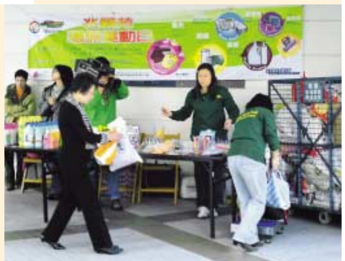
為推動住戶循環再用，集團於旗下屋苑定期舉辦回收報紙、舊衣物及其他物品的活動。