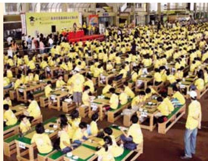
第一屆新地盃兒童圍棋名人公開大賽共有一千人參加，開創香港有史以來最大規模的圍棋比賽。