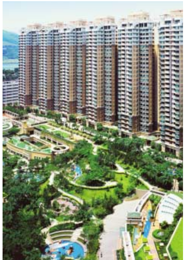
環保元素是集團發展物業的重要部分，為住戶締造舒適綠化生活，珀麗灣第三期Oceanfront的青蔥環境是其中典範。

集團不但在旗下屋苑推行環保項目，亦積極參與社區環保活動，例如贊助長春社舉辦「環保行2005」活動，以及參加由綠色力量舉辦的「第十二屆綠色力量環島行」等。