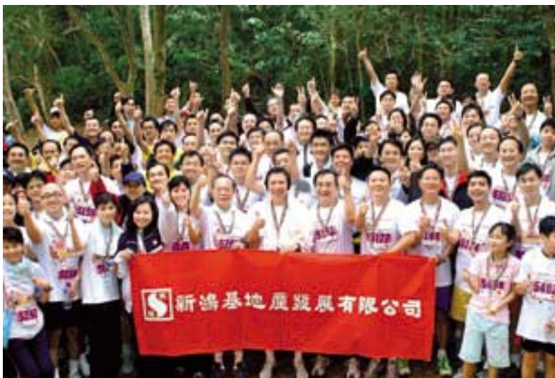
集團副主席兼董事總經理郭炳江(中)與新地員工參與公益金主辦的公益慈善馬拉松活動。

透過推行見習行政人員及見習工程人員培訓計劃，集團從多間具領導地位的大學中挑選精英，提供在集團各業務範疇工作的機會和專業資格訓練，再按其潛質作進一步培訓，令他們得到全面發展，於未來承擔更大責任。本集團同時為中學生及大學生提供觀摩和實習的機會，協助他們擴闊視野，為未來踏足商業社會作好準備。