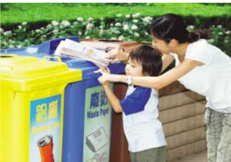
集團鼓勵住戶將廢物分類，締造更清潔環境。