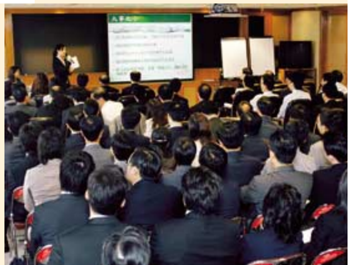
定期為員工舉辦講座，讓他們瞭解市場最新趨勢。