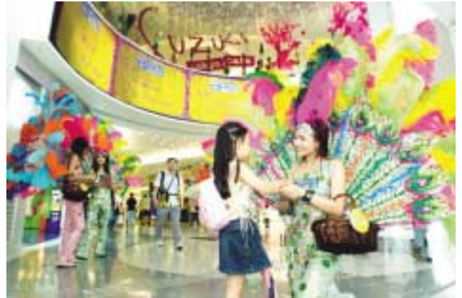
APM商場的親客大使為顧客提供親切及超卓服務。

與此同時，集團亦透過互聯網、電郵及「新地論壇」加強與顧客溝通。除適時發放最新集團動向外，網站內容亦經重新編排，新增多個欄目如企業管治、香港個別經濟統計數據及客戶嘉許信等，使