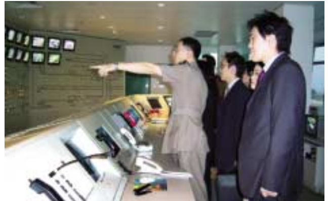
見習行政人員參觀旗下三號幹線(郊野公園段)控制室，認識集團不同範疇的業務。

公餘以外，集團亦為員工舉辦多姿多采的活動，如舉辦各式各樣興趣班，由烹飪、壓力管理及數碼攝影，以至戶外康樂及運動，包羅萬有。這些活動有助建立團隊精神，以及增進部門之間的交流和合作默契。