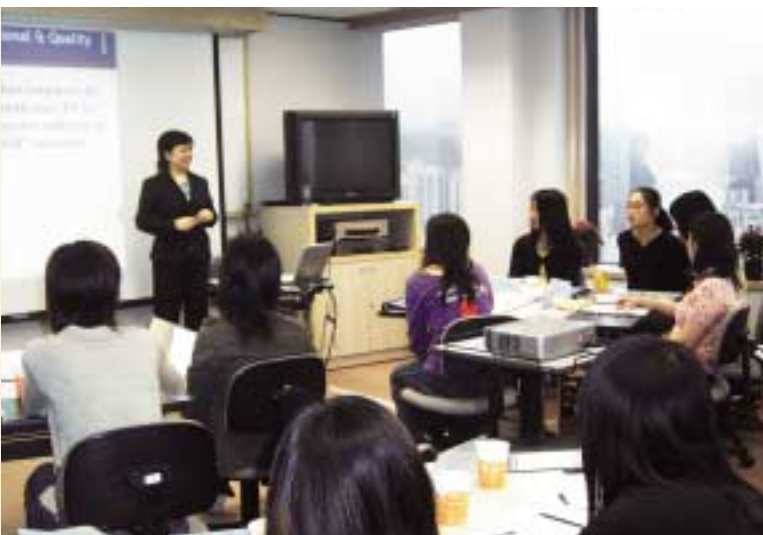
集團為各職級員工提供多元化的培訓課程，鼓勵員工終身學習。