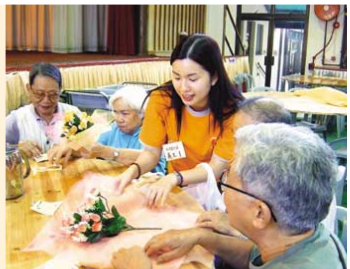
新地義工隊拓展服務層面，幫助更多有需要社群，包括協助長者享受晚年生活。