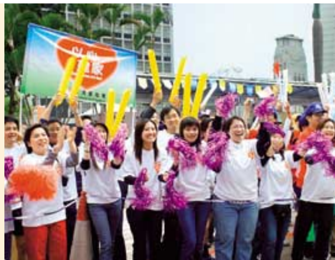
員工參與公益活動，幫助有需要社群，同時發揮團隊精神。