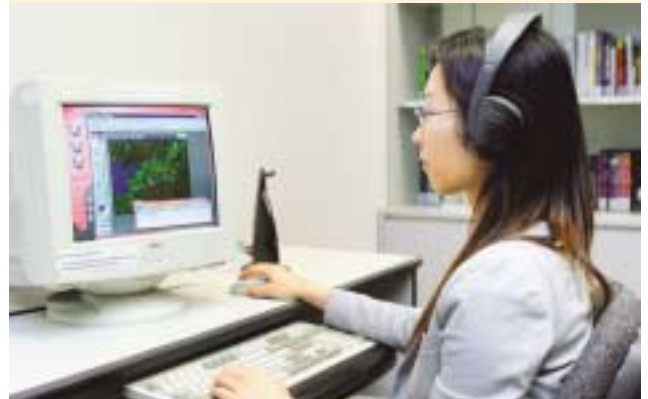
員工透過集團內聯網於網上靈活學習。