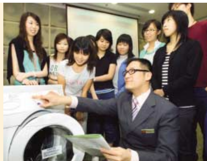
集團為買家提供全面服務，例如圖示交樓小組職員向新業主示範如何操作家庭電器。