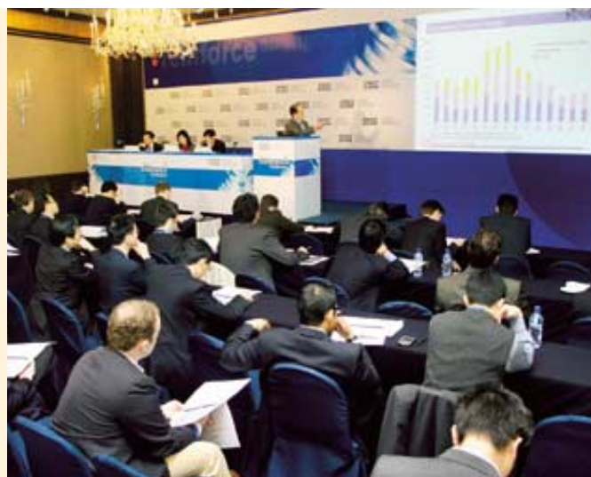
集團於公佈業績後舉行分析員簡報會(左)，以及透過研討會向基金經理解釋業務策略(右)，致力加強透明度。