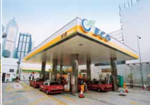
易高 - 石油氣加氣站