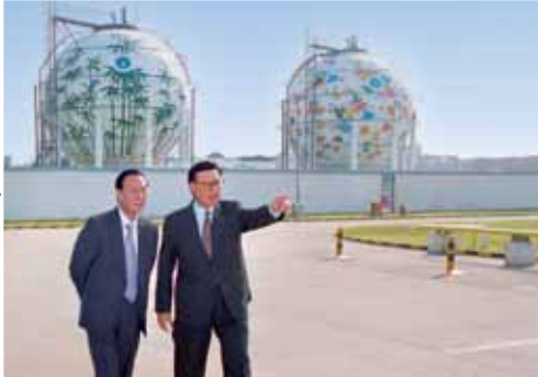
主席李兆基博士視察華東合資業務