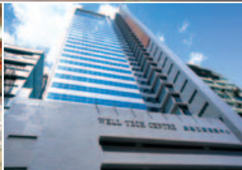
新蒲崗－威達工貿商業中心