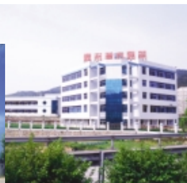
貴州漢方製藥有限公司