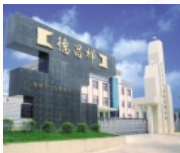
貴州德昌祥藥業有限公司

華瀚於本年度內的業績繼續維持理想增長。於本年度，本集團錄得營業額約 601,900,000 港元，較上年度之 507,000,000 港元，增長 18.7%。本年度營業額約 383,600,000 港元源自本集團自家產品的營業額，較去年增長 40.4%，毛利率維持於 37.8% 的高水準，而約 218,300,000 港元的營業額則為來自醫藥貿易業務的收入。本年度華瀚股東的應佔溢利約為 102,100,000 港元，較去年增長 7.5%。