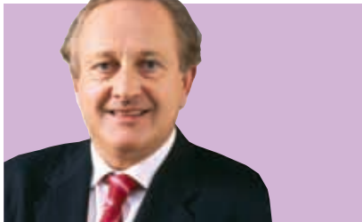
副主席及非執行董事