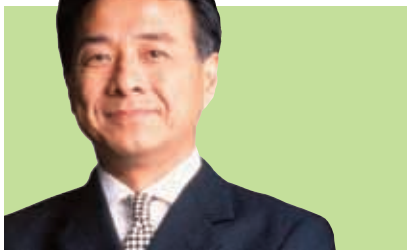
董事會主席 提名委員會主席 非執行董事