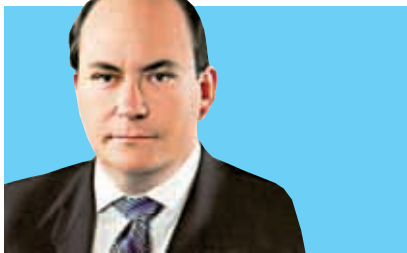
審核委員會主席 獨立非執行董事