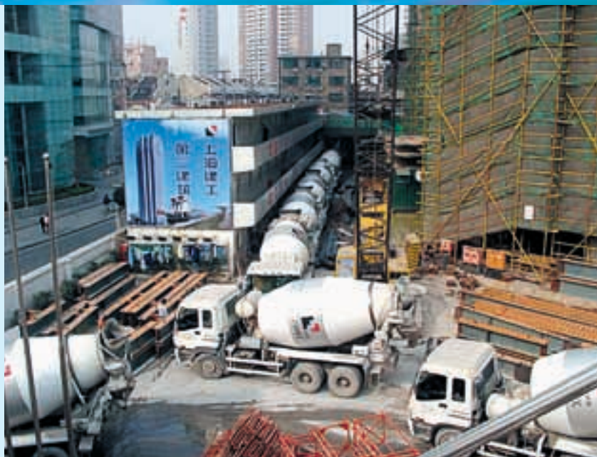
上海廖創興金融中心，建築地盤現況

根據該計劃，在沒有獲得本公司股東事先批准下，認股權可授出股份總數不得超出本公司不時已發行股本之10%。而在沒有獲得本