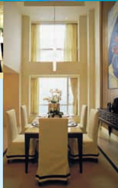
東湖御苑：會所及室內裝修

若干對上述交易並無直接或間接利益之董事認為上述交易均屬本集團經常業務，並按照一般商業條款進行。