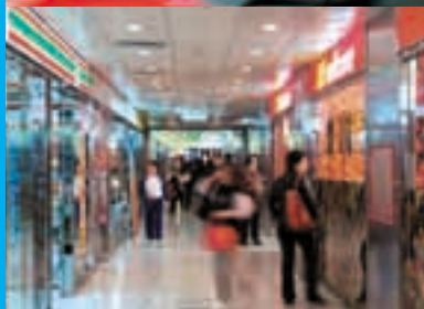
創業商場入口及其內貌