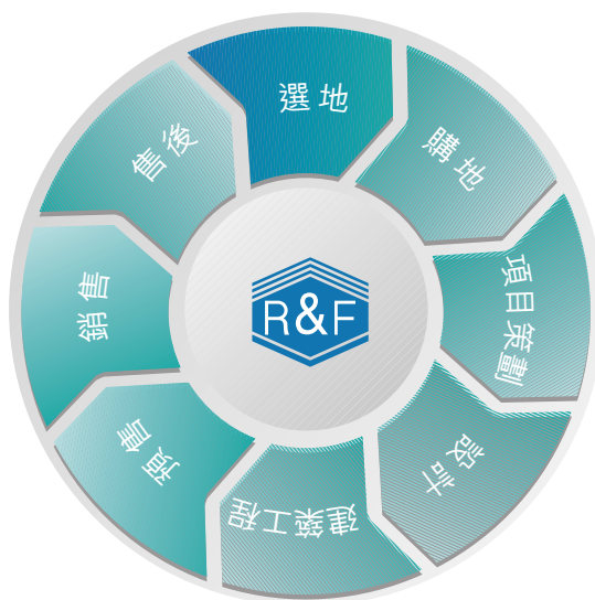
本集團擁有物業發展業務所需的一體化職能部門

為了配合本集團新的發展戰略，本集團於二零零三年十一月投資設立廣州富力美好置業發展有限公司，該公司主要業務為行銷策劃、市場調研、項目可行性研究、商業項目招租、二手物業租售代理。