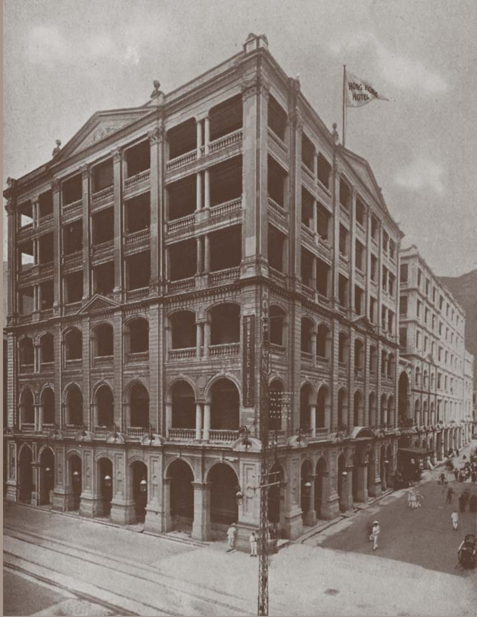
座落於中環的香港大酒店 (The Hongkong Hotel)