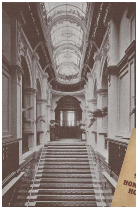
右 酒店簡介和收費 左 香港大酒店

游說進行的龐大填海計劃。這幢樓宇當時租金每年10,000港元，租約直至1890年底屆滿，填海工程正於是年展開。