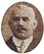
Ellis Kadoorie 爵士

亡。意外令本已「偏低」的入住率更趨惡化，結果新翼首期不得不延遲至1889年8月開幕。當時獲批准的建築圖則，可將酒店擴建至當1904年填海工程完成時將會舖建的德輔道，第二期亦即最後一期的擴建部份於1892年啟用。