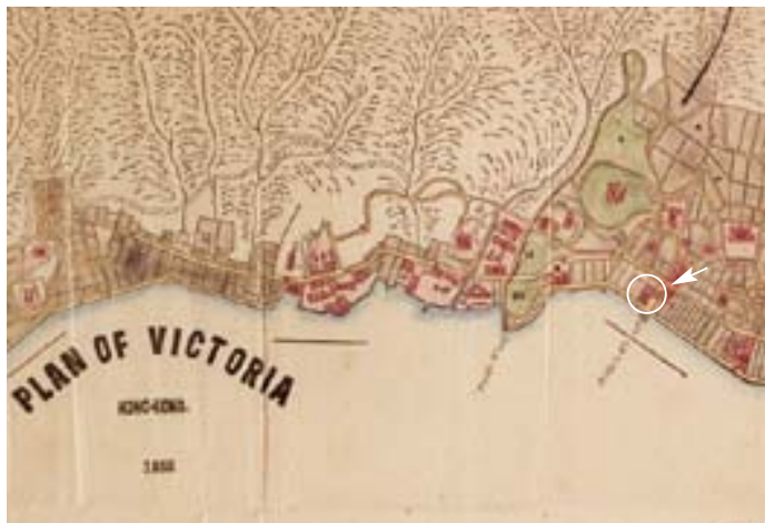
Gustav von Overbeck購入圈中所示土地然後售予The Hongkong Hotel Company

Overbeck受僱於顛地洋行，名列一眾「助理」之首，但事實證明這位男爵絕非泛泛之輩。當酒店公司於1865年10月成立時，顛地的董事將他們在皇后大道、畢打碼頭（畢打街）及海傍之間擁有的一半土地（即今日中建大廈所在地），出讓給von Overbeck。根據紀錄，當時售價為46,000港元。於1866年12月，