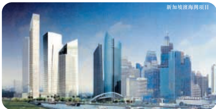
新加坡濱海灣項目