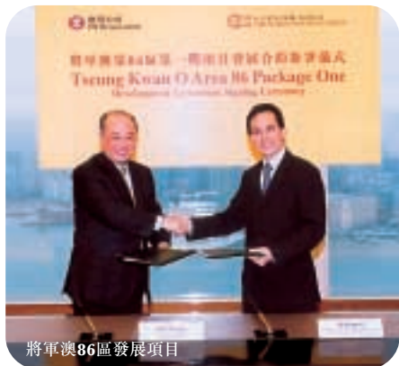
將軍澳86區發展項目