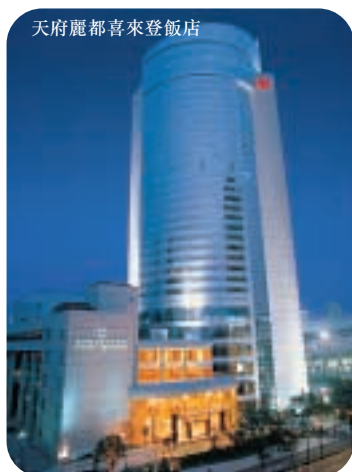
天府麗都喜來登飯店