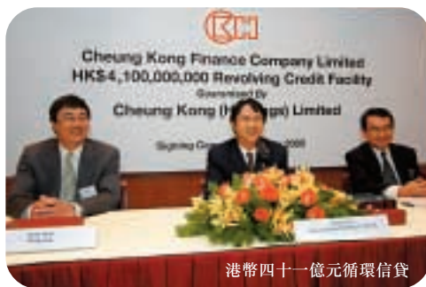
港幣四十一億元循環信貸