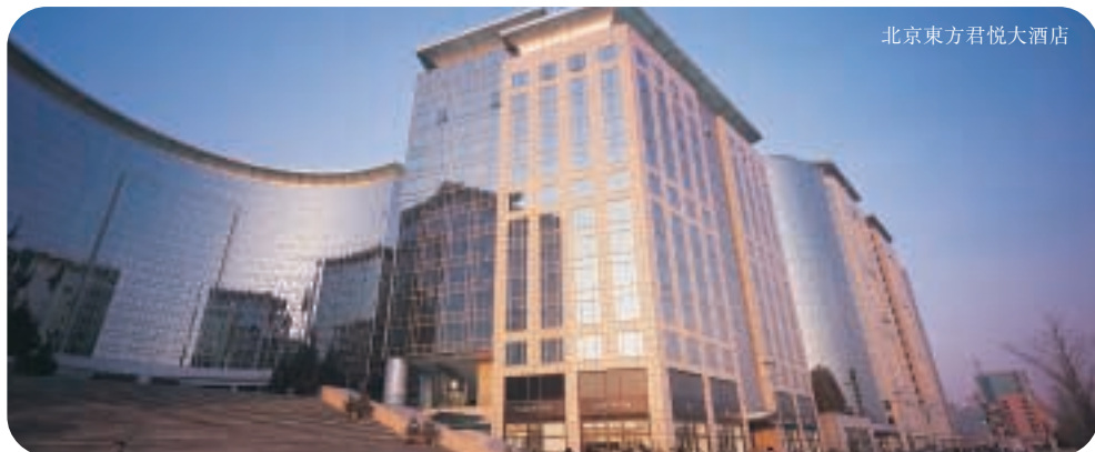
北京東方君悅大酒店