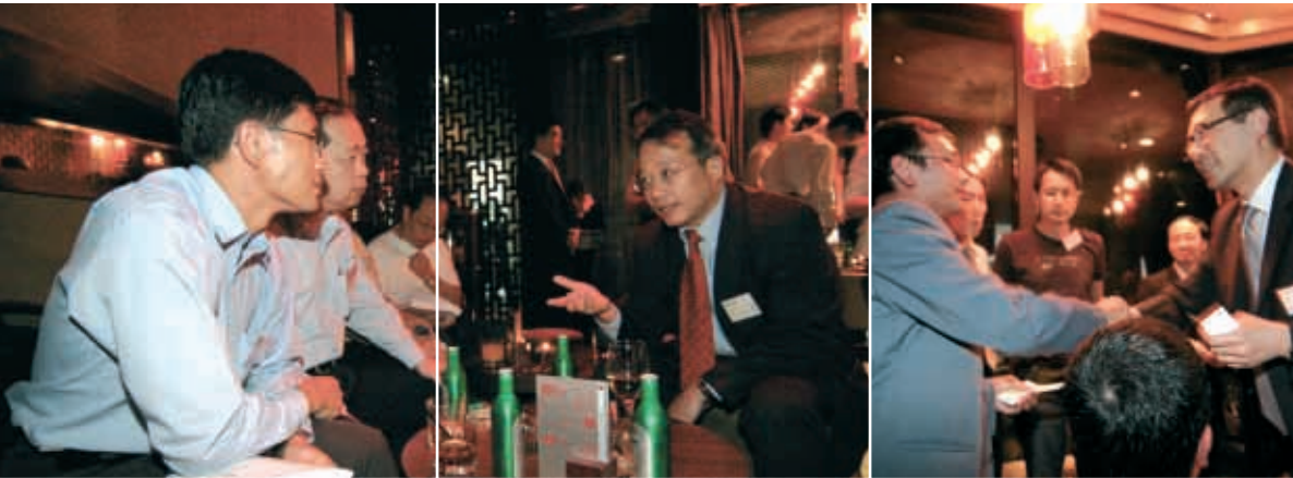
集團非常重視與投資者的溝通，透過不同渠道向他們講解公司的最新發展情況，證券商聚會便屬其中一項定期活動