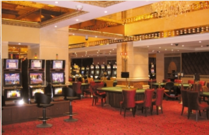
位於澳門鑽石娛樂場第一層之角子老虎機角落。