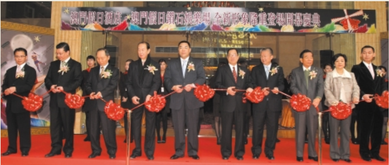
澳門鑽石娛樂場於二零零六年一月盛大開幕。

於回顧年內，本集團之健康及美容服務業務營業額錄得約13%增長至港幣約26,000,000元。由於有效的成本控制措施及無須計入二零零四年度產生之一筆過龐大搬遷及裝修開支，因此，此業務分部之淨虧損更進一步減少47%至港幣約4,000,000元。乘近年本地經濟復甦之勢頭，Headquarters致力維護其高檔次及專業形象，並打入消費力持續強勁的年輕時尚一族。於回顧年度內，本集團於銅鑼灣Beaute@Sogo開設的修甲服務專櫃Nailquarters，於二零零五年十月租約期屆滿後結束營運。