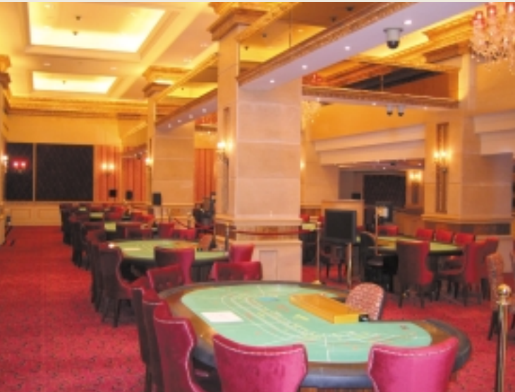
位於澳門鑽石娛樂場第一層大堂。