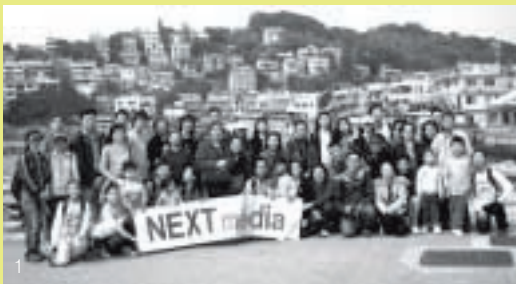
1 員工及其親友一齊參與「南丫島一日遊」活動，以鼓勵大家閒時應進行多些有益身心的運動