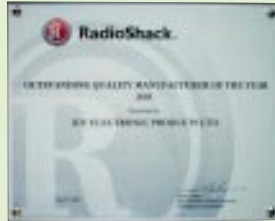
RadioShack 2005年 傑出質素製造商